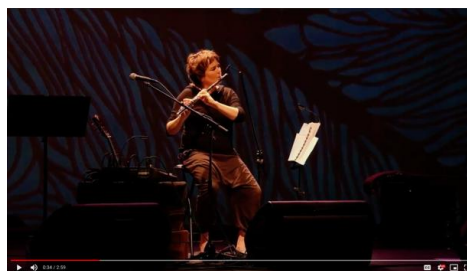
Video 2. Ejemplo de base de acompañamiento del tema “Tiempo Robado”. Video anotado del Concierto en el Auditorio de Guadalupe, Murcia, el 2 de mayo de 2019. Descargable en: http://tiny.cc/tiemporobado_2019

El tema de esta investigación surge de la necesidad de comprender, analizar y reflexionar sobre la experiencia artística que vengo desarrollando en la actualidad en un proyecto personal de creación e improvisación musical. En él realizo improvisaciones sustentadas sobre bases con diferentes materiales rítmicos, armónicos y melódicos (grabados en directo en tres pedales que funcionan a modo de loop ), con los que voy jugando e interaccionando posteriormente en improvisaciones con la flauta travesera.