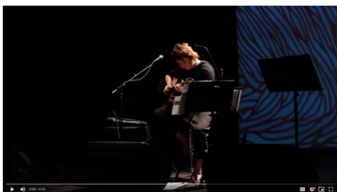
Video 1. Ejemplo de base de acompañamiento del tema “Pantanosá” de Elena Sáenz. Video anotado del Concierto en el Auditorio de Guadalupe, Murcia, el 2 de mayo de 2019. Descargable en: http://tiny.cc/pantanosá_2019