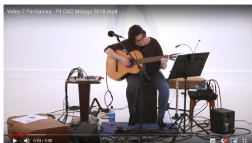
Video 4. Pantanosa. Performance realizada el 23 de febrero de 2017, a solo, en el Centro de Arte Contemporáneo de Málaga. Descargable en: http://tiny.cc/pantanosaCAC2017

La segunda improvisación registrada tras la autoobservación del audiovisual, es la de la performance realizada el 23 de febrero de 2017 en el Centro de Arte contemporáneo Málaga (ver vídeo 3, minuto 5 y 18 segundos). En la tabla 3 se encuentra su análisis formal. La simbología de la tabla se puede ver en la figura 6. La duración de la improvisación es de 1 minuto y 3 segundos y la de cada loop es de 30 segundos a 88 bpm la negra.