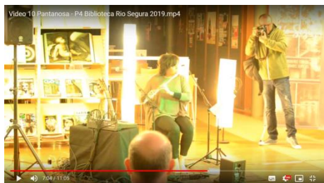
Video 5. Pantanosa. Performance realizada el 12 de diciembre de 2019 a solo, en la Biblioteca Río Segura de Murcia. Descargable en: http://tiny.cc/pantanosaBRS2019