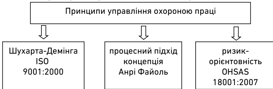
Рис. 2. Принципи системи управління охороною праці

Як відомо [3], існує три вихідні принципи при побудові системи менеджменту охорони праці, що наведені на рис. 2.