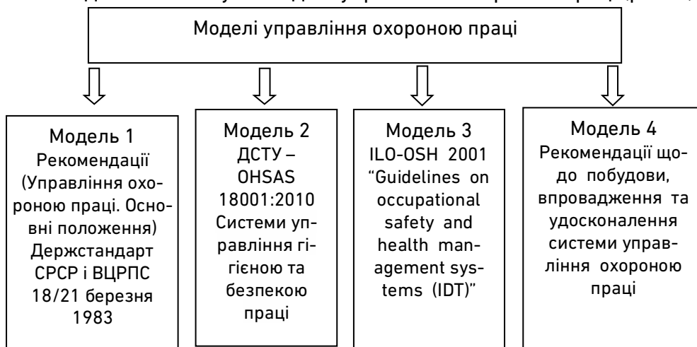
Рис. 1. Моделі системи управління охороною праці

На даний час існує 4 моделі управління охороною праці (рис. 1).