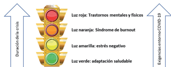
Figura 2. Semaforización del proceso psicosocial ante el COVID-19: el burnout una luz naranja.

Con lo anterior, es posible alinear el proceso del burnout a los paradigmas de prevención primaria, secundaria y terciaria en salud pública 38 y aplicarlo al contexto actual de la pandemia por COVID-19. De forma que, las acciones de prevención primaria corresponden a una atención a los factores causales o predisponentes, en este caso, las condiciones estresantes del trabajo que están enfrentando los profesionales de la salud y han sido antes mencionados; la prevención secundaria se enfocaría a la sintomatología del estrés y burnout como proceso previo a trastornos más severos y estables, por lo que su monitoreo actual se vuelve trascendente; y finalmente, la prevención terciaria implicaría medidas orientadas al tratamiento ad integrum de trastornos o enfermedades clínicamente más severas y de menor reversibilidad, mediante distintas estrategias orientadas a la rehabilitación. Así, es posible un modelo de semaforización donde los procesos de estrés y burnout son claves en la prevención más temprana de trastornos severos de salud mental y física por causa de la pandemia de COVID-19, como se muestra en la Figura 2 .