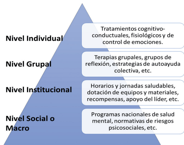
Figura 3. Niveles de intervención en burnout y salud mental en trabajadores de la salud ante COVID-19.