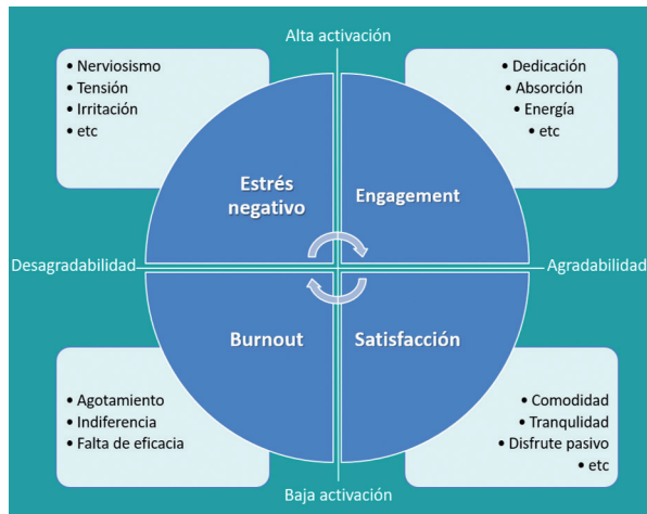
Figura 1. Modelo Circunflejo de Bienestar Psicológico. (adaptado de Russell, 1980) 28 .

En el 2019 la OMS incluyó al síndrome de burnout en la lista de la Clasificación Internacional de Enfermedades (CIE-11) ( QD85 Burn-out ), sin embargo, no lo incluye como una condición médica, sino como un fenómeno ocupacional dentro de los “problemas asociados con el empleo o el desempleo” y se describe también en el capítulo “factores que influyen en el estado de salud o que necesitan atención de servicios médicos”, pero no propiamente clasificado como enfermedad o trastorno de salud 30 .