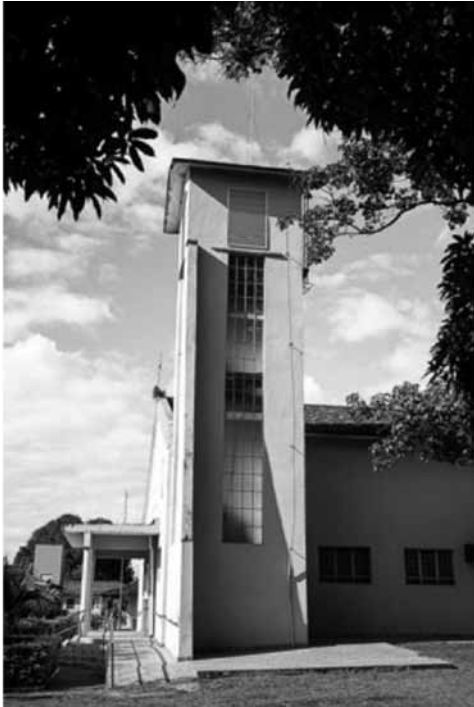
Imagem 1 (esquerda). Foto da Vila Vicentina (Sem data exata). Fonte: Acervo de Ariadne Franco Mathias e Lucas Melara. Imagem 2 (abaixo). Aniversário dos abrigados acompanhados de voluntários. Fonte: Acervo de Ariadne Franco Mathias e Lucas Melara.