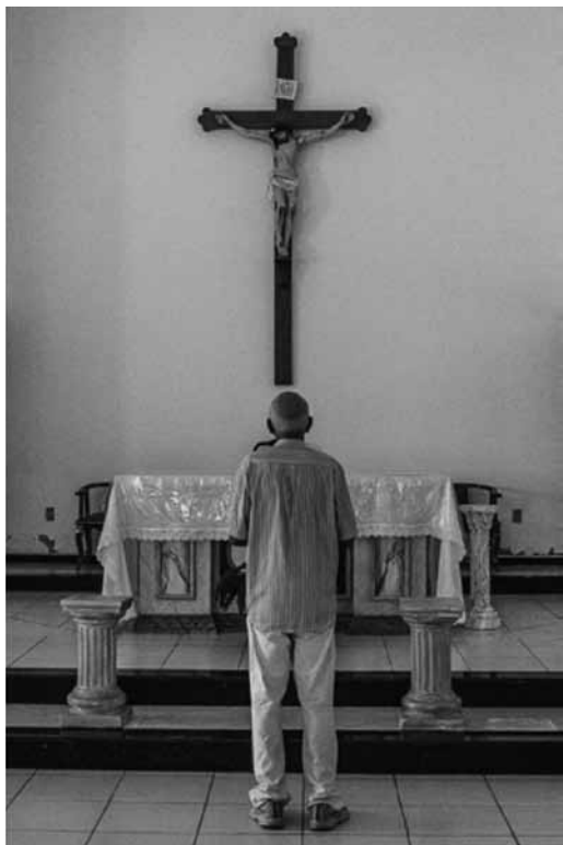
Imagem 5 (esquerda): Fotografia inserida no livro.