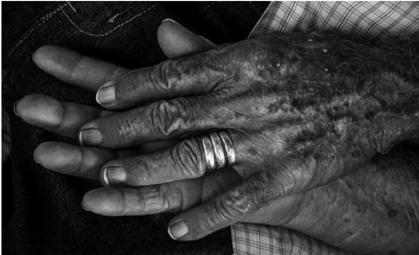
Imagem 7. Fotografia da capa.

A experiência desdobrou-se em registros plenos de significados, que reforçam o caráter afetivo e emocional do Design Social, bem como estreitam as relações entre diversas áreas de conhecimento. Como observa Rafael Cardoso: