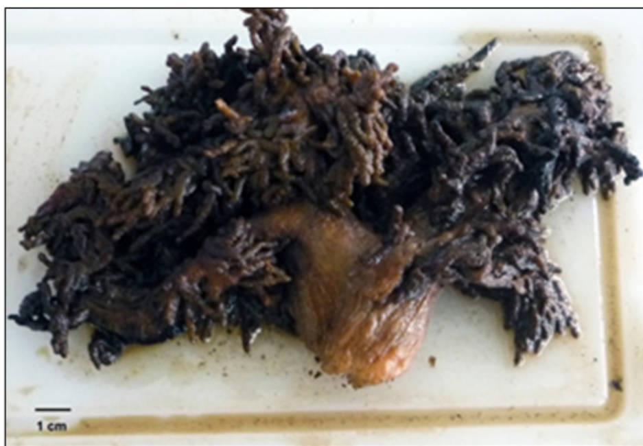
Gambar 2. Karang Lunak Sinularia sp hasil sampling. Figure 2. Sinularia sp. Soft Coral sampling result.

dan Sinularia kavarattiensis (Rajaram et al. , 2014). Metabolit steroid umumnya memiliki aktivitas sebagai antibakteri (Alhaddad et al. , 2019). Mekanisme kerja antibakteri dari metabolit steroid diduga dengan merusak membran sel bakteri (Cowan, 1999). Vickery & Vickery (1981) menyatakan metabolit steroid berkerja dengan meningkatkan permeabilitas membran sel bakteri, sehingga menyebabkan kebocoran sel bakteri.