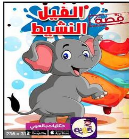
شكل (4) يوضح غلاف كتاب (الفيل النشيط)

لكي تكتمل عملية الإتصال وقياس نجاح عملية التسويق فلا بد أن يحقق هذا المنتج نجاحه في السوق ويقاس هذا النجاح بزيادة الطلب عليه مما سبق نستخلص أننا لنحقق أعلى تسويق لكتب الأطفال يجب أن يتم التكامل بين المرسل (المصمم) والرسالة (الكتاب) والمستقبل (الطفل) ليتحقق النجاح للعملية التسويقية. وهنا يعد الكتاب بائعاً صامتاً (إتصال غير مباشر) يجذب الطفل إليه من خلال التصميم المرتكز على الأسس والعناصر العلمية المناسبة. (18)