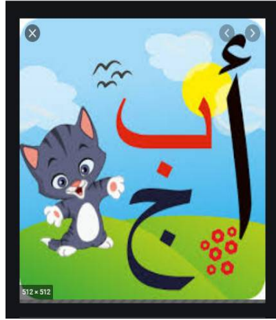
شكل (3) يوضح غلاف كتاب (ا ب ج)

ذلك من خلال أغلفة كتب الأطفال نجد أن غلاف كتاب الأطفال يجب أن يصمم ليحذب الطفل للكتاب ويحثه على قراءته وشرائه، لذلك يجب على المصمم إدراك عناصر التصميم ودراستها ليكون منها غلافاً ناجحاً يجذب الطفل ويحقق القوة الشرائية المطلوبة. (13، ص52)