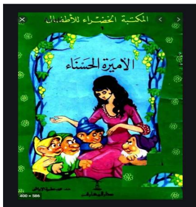
شكل (2) يوضح غلاف كتاب (الأميرة الحسنة)