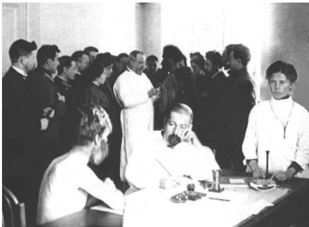
Прием терапевтических больных в амбулатории факультетских клиник ведут профессор М.Г. Курлов (стоит в центре на заднем плане) и приват-доцент Н.Д. Либеров (сидит в центре на переднем плане), 1909 г.

гинекологической, факультетской хирургической, детских болезней, глазных болезней и госпитальной хирургической клиник. С выделением из состава университета медицинского института в амбулатории разместилась администрация института, а амбулаторный прием был переведен в городские больницы.