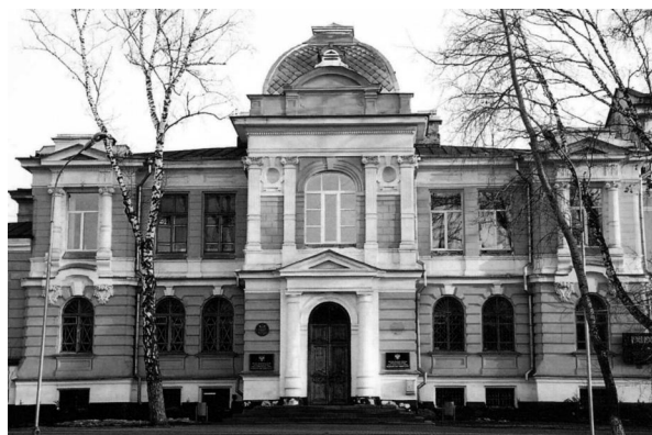
Главный корпус Сибирского государственного медицинского университета, 2003 г.