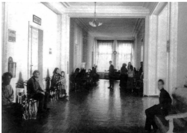
Страждущие пациенты в ожидании приема в амбулатории факультетских клиник, 1909 г.

Западная часть факультетских клиник. После окончания строительства в 1916 г. корпус новых факультетских клиник сразу же был занят военным ведомством под солдатские казармы (до 1920 г.). Затем в нем находилась совпартшкола, и только с 1926 г. разместились клиники. На первом этаже — клиника детских болезней, на втором — клиника