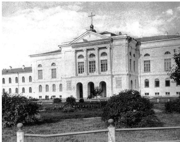
Императорский Томский университет

пии, акушерству и лабораторной диагностике. В полуподвальном помещении проводился прием амбулаторных больных.