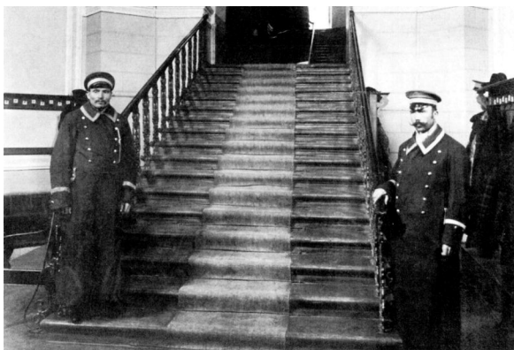
Парадный вход факультетских клиник, охраняемый бравыми швейцарами, 1904 г.

ства клиник по решению попечителя университета В.М. Флоринского была открыта клиническая домовая церковь, которая разместилась в обычном помещении северного крыла факультетских клиник.