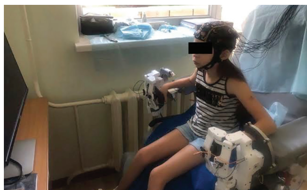
Рис. 4. Сеанс реабилитации с использованием комплекса «Экзокисть-2»

Как уже отмечалось, наиболее оптимальным для нейрореабилитации считают применение ИМК вместе с управляемым им экзоскелетом [38]. В этом случае центральная моторная команда подкрепляется афферентными кинестетическими сигналами о ее исполнении экзоскелетом, т.е. дополнена БОС. Однако, насколько нам известно, подобная система применена для коррекции двигательных функций верхних конечностей у детей с ДЦП пока лишь в одном клиническом исследовании, выполненном сотрудниками Крымского федерального университета имени В.И. Вернадского [50]. В этой работе применялся комплекс «Экзокисть-2» с неинвазивным ИМК (рис. 4), отводящим ЭЭГ от фронтальных, центральных и париетальных областей коры.