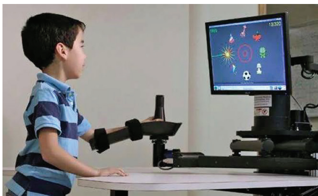
Рис. 1. Система InMotion 2 (коммерческая версия MIT MANUS) [26]

направлениях с заданным уровнем поддержки со стороны устройства [24–26]. Сразу в нескольких исследованиях [27–29] отмечается положительная динамика после 6–8-недельного курса использования системы InMotion 2 у детей с ДЦП. Выявлено снижение мышечного тонуса и улучшение кинематических показателей: увеличение скорости и улучшение плавности движений руки.