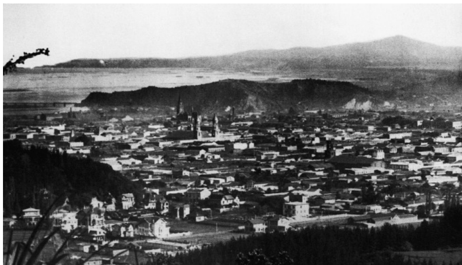
Fig. 01. Panorámica de Concepción, ca. 1920.

Ubicada en la zona centro-sur de Chile, la ciudad de Concepción fue fundada en 1550 y refundada en 1758 en un emplazamiento diferente al original, producto de un terremoto y posterior maremoto. La incidencia de las catástrofes sísmicas acentuó sucesivas transformaciones urbanas en sus 465 años de historia, que renovaron la urbe una y otra vez coincidiendo con cambios culturales, estilísticos, sociales y arquitectónicos. La arquitectura en Concepción ha dado cuenta de esos hechos.