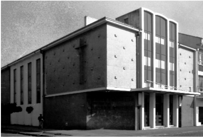
Fig. 08. Luz Sobrino, Templo Bautista, Concepción (Chile), 1965. Fig. 09. Santiago Roi y Ricardo Hempel, iglesia parroquial de Nuestra Señora del Carmen, Penco (Chile), 1965. Fig. 11. Víctor Lobos, iglesia parroquial de Santa Cecilia, Talcahuano (Chile), 1965.