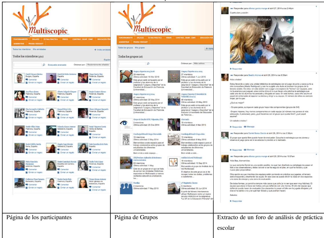
Figura 1. Ejemplos del aspecto de la plataforma MultiScopic

Artículo Original. (Re)Produce: desarrollo profesional docente en una comunidad de práctica virtual informal de Educación Física. Vol. IV, nº. 3; p. 480-507, septiembre 2018. A Coruña. España ISSN 2386-8333