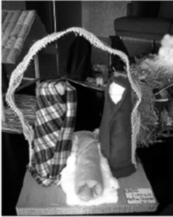
Figura 3: Presépios Elaborados pelos Alunos