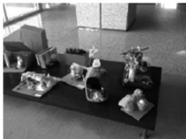
Figura 1: Presépios Elaborados pelos Alunos