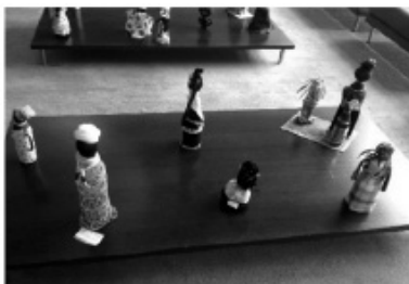
Figura 7: Exposição de Bonecas Africanas