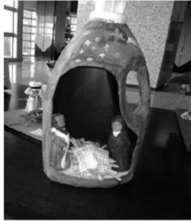
Figura 4: Presépios Elaborados pelos Alunos

nas instalações da Câmara Municipal da Maia, (Figuras 1,2,3 e 4) por se considerar um local estratégico para a divulgação dos trabalhos e da criatividade dos alunos no âmbito da temática que estava a ser explorada, ao mesmo tempo que as exposições criam um espaço de partilha de conhecimento, sendo um meio de comunicação e de aprendizagem por excelência.