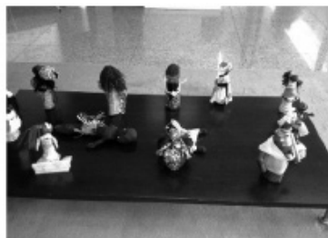
Figura 8: Exposição de Bonecas Africanas