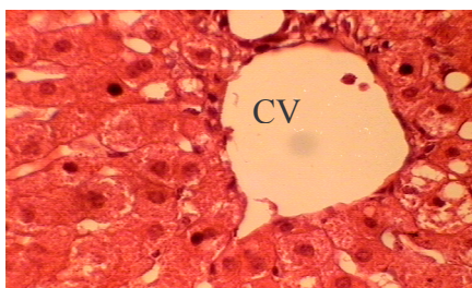
شکل ۳- مقطع میکروسکوپی از بافت کبد خرگوش گروه دریافت کننده کلسترول. رنگ آمیزی هماتوکسیلین اتوزین با بزرگنمایی ۴۰۰×. پیکان محل رسوب کلسترول را نشان می‌دهد. CV: ورید مرکز لبولی.