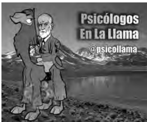
Figura 1. Imagen de referencia de la iniciativa www.psicologosenlallama.com .

Existen diversos sistemas de recogida de datos que permiten conocer la calidad del proyecto y el diseño de propuestas de mejora. La página se revisa cada quince días y, si es preciso, se incorporan nuevas medidas con el fin de evaluar su influencia positiva en la población objetivo.