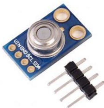
Gambar 3 Sensor Suhu MLX90614

Pada penelitian ini hanya terbatas pada monitoring suhu tubuh manusia dengan pancaran sinar inframerah. Bahan yang digunakan pada penelitian ini antara lain, Arduino Uno, sensor suhu infrared Gy-906 MLX90614, LCD 16x2, i2c LCD, kabel female-male , breadboard serta kabel USB atau menggunakan baterai. Serta bahan yang diperlukan adalah laptop + software proteus. Sesuai dengan datasheet MLX90614, sensor ini mampu menjangkau suhu suatu objek antar -70 hingga +380°C. Sensor ini bekerja dengan menyerap sinar inframerah yang dipancarkan suatu benda di depannya serta sensor ini bekerja tidak bersentuhan fisik dengan benda yang dikur ( contactless ) sehingga tidak menyebarkan virus korona yang menyebar melalui tangan/kulit. Sensor yang memiliki 4 kaki ini bekerja pada tegangan masukan sebesar 3,3/5 Volt. Adapun pin out dari board MLX90614 adalah sebagai berikut: 1)Vin adalah tegangan supply dari modul; 2)GND adalah sinyal ground; 3)SCL adalah serial clock; 4) SDA adalah serial data. Gambar sensor tersebut ditunjukkan pada Gambar 1. Sedangkan wiring sensor dengan Arduino disajikan pada Tabel 1.