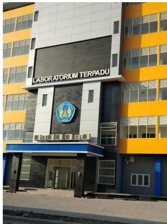
Gambar 4. Lokasi Pemasangan Alat

Perancangan alat ini dilakukan di Lab. Terpadu lantai 5 UNIPMA, laboratorium Teknik Elektro. Alat ini direncanakan dipasang di depan pintu masuk lab terpadu tepatnya. Sehingga jika ada mahasiswa/ dosen yang memasuki kampus langsung melakukan pengukuran suhu tubuh secara mandiri. Lokasi pemasangan ditunjukkan pada Gambar 4.