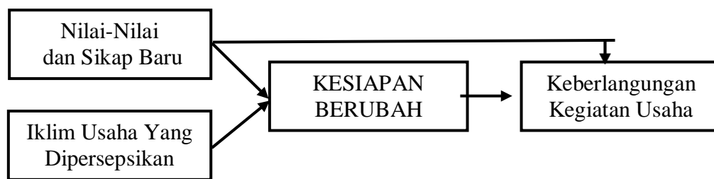
Gambar 2. Temuan Jalur Pembentuk Keberlangsungan Kegiatan Usaha

Berdasarkan hasil uji persamaan jalur sub struktur 1 dan sub struktur 2, maka penelitian ini berhasil mengidentifikasi berbagai jalur hubungan antar variabel yang paling fit, sebagaimana tampak pada gambar 2.