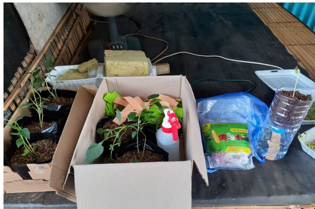
Gambar 7. Bentuk HIDBOKAS