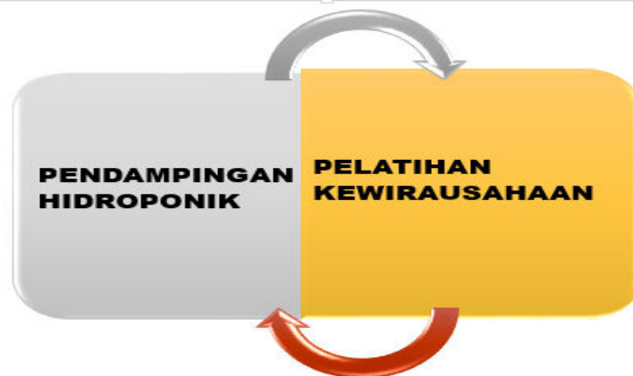
Gambar 3. Bentuk Pelaksanaan Kegiatan IbM pada Ibu-Ibu Pemulung dengan “MAGER HIDBOKAS”

Gambar 3 memberikan gambaran mengenai tahapan pelaksanaan kegiatan IbM pada mitra kami dengan bentuk: