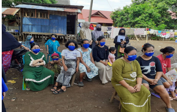
Gambar 6. Tim Rumah Hidroponik Melakukan Sosialisasi