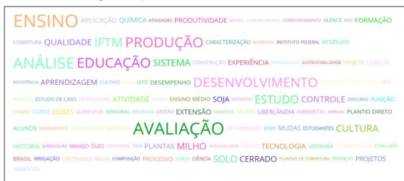
Figura 2 – Nuvem representando as palavras-chave mais utilizadas em produções científicas dos docentes do IFTM

Com a análise de frequência de palavras-chave, percebe-se que o maior número de pesquisas do IFTM está nas áreas de Ensino, Educação, Agrárias e Alimentos.