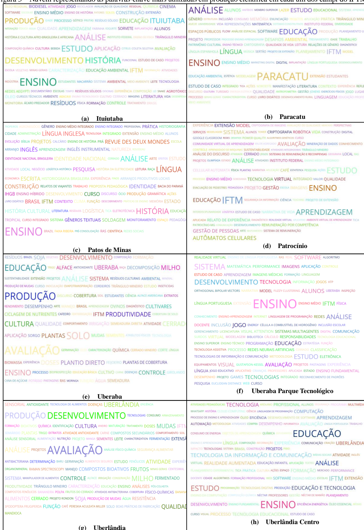
Figura 3 – Nuvem representando as palavras-chave mais utilizadas em produção científica em cada um dos campi do IFTM