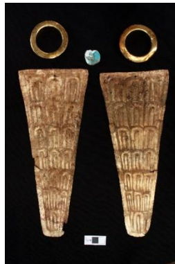
Fig. 4 Ofrendas de oro asociadas a la tumba de Dama de Pacopampa

Durante estos trece años de investigación, siempre he tenido en cuenta la colaboración con la comunidad a través de reuniones de explicación del trabajo y exposiciones temporales de las piezas recuperadas en las excavaciones (Seki, 2017). Además, hemos encargado a la comunidad la selección y el salario de los trabajadores del proyecto. Este esfuerzo surtió efecto y la Asociación Cultural de Pacopampa fue fundada voluntariamente para conservar el sitio arqueológico en el año 2012. El motivo de la fundación de la asociación fue el descubrimiento de tumbas con ofrendas suntuosas (Fig. 4).