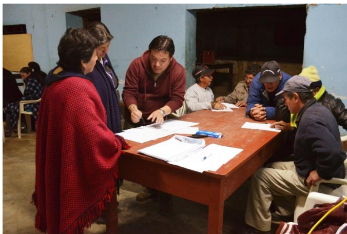
Fig. 6 Taller para recuperar informaciones de las culturas inmateriales del pueblo

recurso en una ficha hecha por nosotros, especificando detalles sobre cuándo, dónde, quién, y cómo se utiliza cada recurso. Se les motivó, además, a realizar dibujos o adjuntar información extra como dibujos, fotografías, etc. Al terminar, cada ficha fue digitalizada inmediatamente (Fig. 6).