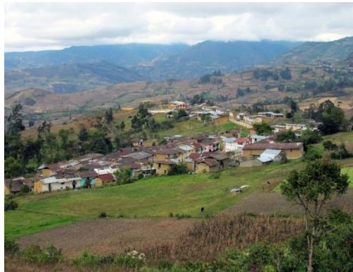
Fig. 3 Pueblo Pacopampa

Es un pueblo con el mismo nombre que el sitio arqueológico y se dice que el pueblo fue fundado hace unos 150 años (Cueva, 1982: 10). Políticamente, pertenece a la categoría de Centro Poblado (pueblo) que se encuentra bajo el Distrito, Provincia y Región. El jefe del pueblo existe, pero es solo un puesto honorario.