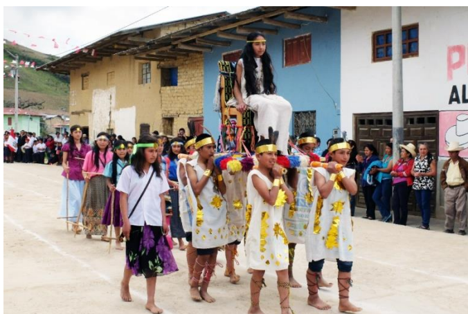
Fig. 5 Desfile de los estudiantes quienes cargan la Dama de Pacopampa