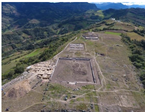
Fig. 2 Vista general del sitio Arqueológico Pacopampa

Está compuesto de tres plataformas grandes. Las construcciones principales se encuentran en la Tercera Plataforma, es decir la plataforma superior (Fig. 2).