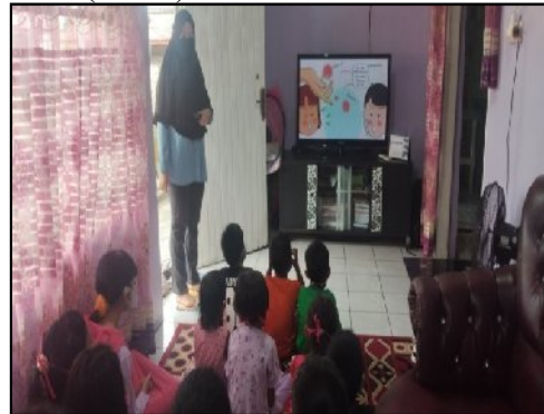
Gambar 1. Penyampaian Materi

dilakukan, pengertian mencuci tangan, tujuan mencuci tangan, waktu yang tepat mencuci tangan dan langkah-langkah mencuci tangan yang benar (Gambar 1). Anak-anak juga diberi pertanyaan secara lisan mengenai langkah-langkah cuci tangan, dan ternyata sebagian besar anak-anak di RT. 14 belum mengetahui langkah-langkah mencuci tangan yang benar sebagaimana aturan Badan Kesehatan Dunia (WHO)