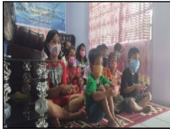
Gambar 3. Mendemonstrasikan Gerakan Mencuci Tangan

untuk mendemostrasikan gerakan langkah-langkah mencuci tangan yang sudah mereka pelajari sebelumnya (Gambar 3)