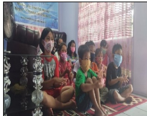
Gambar 2. Mengikuti Gerakan Mencuci Tangan

Selain memberi informasi secara lisan kepada anak-anak, tim penyuluhan juga memberi informasi melalui video. Terlihat anak-anak antusias menonton video langkah-langkah mencuci tangan. Anak-anak pun sembari mengikuti gerakan yang ditayangkan (Gambar 2). Sesi tanya jawab juga diberikan kepada anak-anak apabila ada hal yang masih membingungkan mereka.