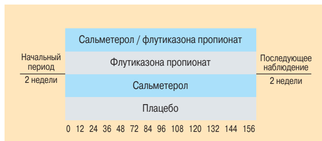
Рис. 1. Дизайн исследования выживаемости TORCH

Пациенты случайным образом (рандомизированно) распределялись в одну по четырем фармакотерапевтическим группам, которые получали при помощи ингалятора Мультидиск два раза в день следующие препараты: сальметерол (САЛ — ДДБА) в дозе 500 мкг, флутиказона пропионат (ФП — иКС) в дозе 500 мкг, комбинированный препарат сальметерола и флутиказона пропионата (САЛ / ФП — 50 / 500 мкг) и плацебо.