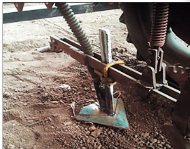
Рис. 3. Экспериментальная установка с лаповым сошником на почвенном канале