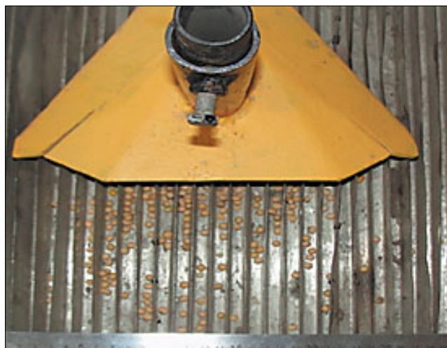
Рис. 2. Распределение семян сои лаповым сошником в желобковой ванночке