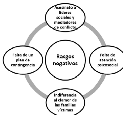
Figura 2. Rasgos negativos del proceso de paz

Asimismo, se pudo agrupar alrededor de la categoría de rasgos negativos en el proceso de paz desde el imaginario del docente las subcategorías siguientes: asesinato a líderes sociales y mediadores de conflicto, falta de atención psicosocial, indiferencia al clamor de las familias víctimas y falta de un plan de contingencia (Figura 2).