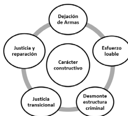
Figura 1. Carácter constructivo del proceso de paz

En torno al carácter constructivo del proceso de paz desde la percepción de los maestros se logra ubicar en el contenido las siguientes categorías como: dejación de armas, esfuerzo loable, desmonte estructura criminal, justicia transicional (que no satisface), justicia y reparación (Figura 1).