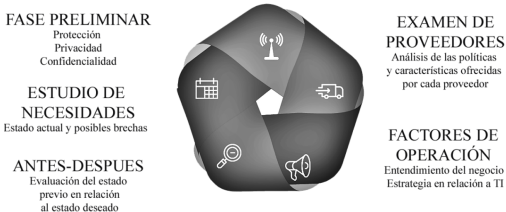
Figura 2. Fases de la guía.