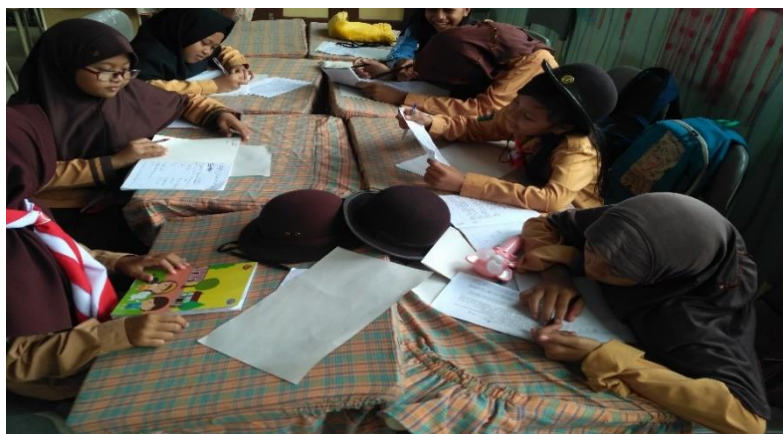
Gambar 3. Peserta didik perempuan diskusi menyelesaikan soal latihan

Pertemuan ke-7 merupakan pertemuan terakhir yakni dilakukannya posttest untuk mengetahui seberapa jauh kemajuan peserta didik selama pembinaan. Soal posttest yang diberikan berbeda dengan soal pretest , akan tetapi memiliki tipe soal yang sama. Hasil posttest yang diperoleh sebagai berikut.