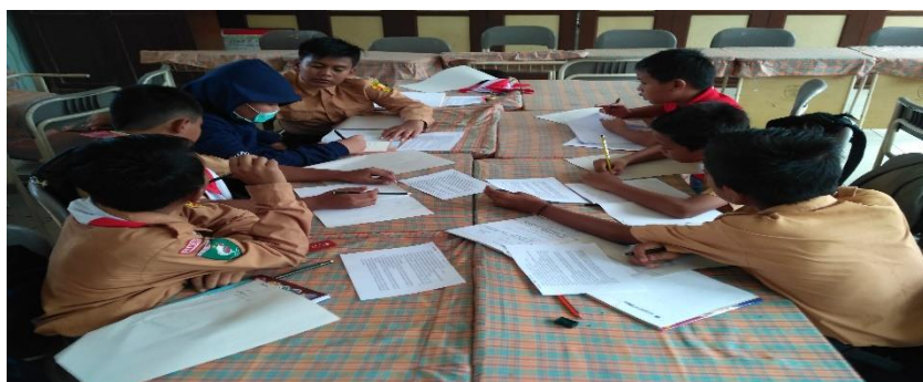
Gambar 2. Peserta didik laki-laki diskusi menyelesaikan soal latihan

Pertemuan ke-4 hingga pertemuan ke-6 diberikan materi geometri. Pada awalnya peserta didik mengalami kesulitan dalam merepresentasikan jawaban yang ada dalam pikirannya. Dikarenakan soal geometri yang diberikan bukanlah soal rutin yang biasanya diberikan di kelas pada saat pembelajaran, akan tetapi soal yang geometri pada level olimpiade adalah soal non rutin yang diperlukan penalaran bagi peserta didik. Hingga di pertemuan ke-6 para peserta didik sudah mampu memahami pola dari permasalahan yang dihadapinya.