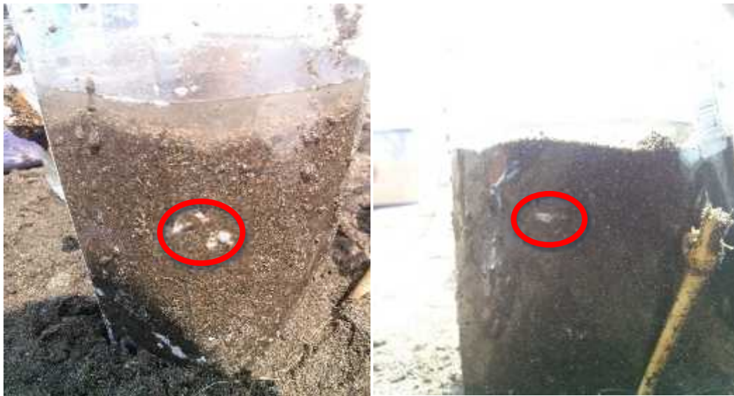
Gambar 4. Pengamatan eksperimen kemampuan yutuk menggali pasir laut (lingkaran merah adalah bagian tubuh yutuk terlihat dari luar)