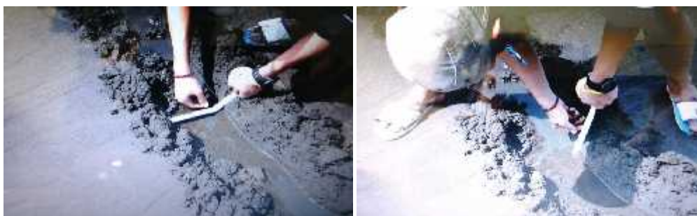
Gambar 6. Contoh pengukuran lebar dan kedalaman pemotongan pasir pantai