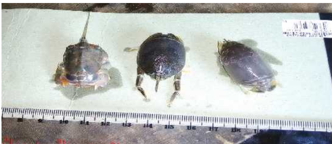
Gambar 3. Tiga spesies yutuk yang berhasil ditangkap, yaitu: Albunea symmysta , Hippa adactyla , dan Emerita emeritus

Setiap spesies dilakukan eksperimen sederhana, yaitu melihat pengaruh spesies, dimensi, jenis kelamin, kondisi kematangan seksual (bertelur atau tidak bertelur) terhadap kedalaman undur-undur laut masuk ke dalam pasir (mengubur diri) yang merupakan pola adaptasi dan kebiasaan hidup. Pengukuran dilakukan dengan menggunakan wadah transparan sehingga mudah untuk diamati dan diukur, sebagaimana ditunjukkan dalam Gambar 4. Pada Tabel 1 dan Tabel 2 disajikan data karakteristik fisik undur-undur laut yang berhasil ditangkap.