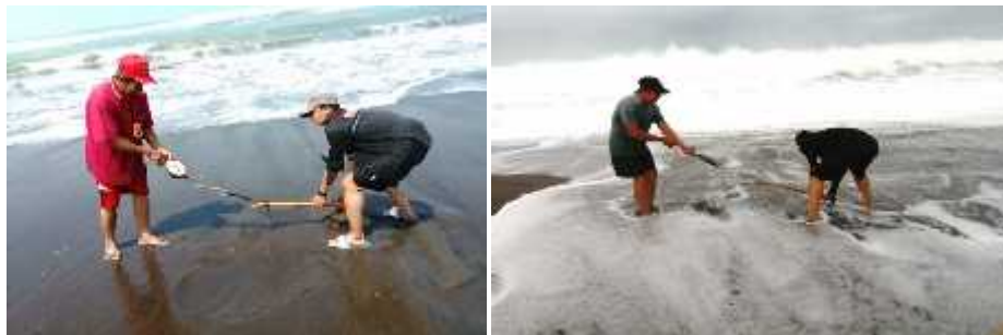
Gambar 5. Contoh pengukuran prediksi besar gaya penarikan

penarikan dan pengukuran luas pemotongan pasir pantai. Draft hasil desain penangkap mekanis undur-undur laut (yutuk) dapat dilihat dalam Gambar 7.