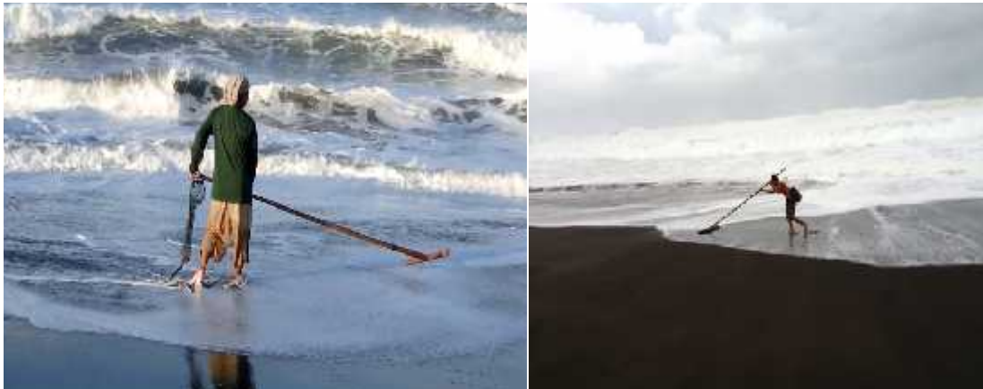
Gambar 2. Alat tangkap tradisional (sorok) untuk mengangkat undur-undur laut

Undur-undur laut (yutuk) ditangkap oleh nelayan lokal (Cilacap dan Kebumen) dengan menggunakan alat tangkap tradisional berupa sorok, atau secara manual menggunakan tangan. Alat tangkap (sorok) ini terbuat dari bambu, sebagaimana ditunjukkan dalam Gambar 2. Penyorokan untuk menangkap undur-undur laut sejauh kurang lebih 1 kilometer dengan hasil tangkapan sebanyak (1.0 – 1.5) kilogram. Penyorokan pasir pantai tersebut hingga kedalaman sekitar 5 cm untuk mengangkat undur-undur laut, kemudian ditangkap menggunakan tangan dan memasukkannya ke dalam keranjang jaring.