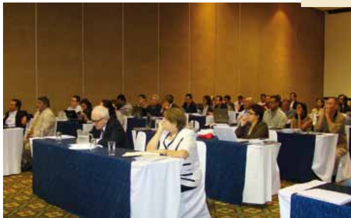
Taller regional sobre el agua y el cambio climático. El Salvador 08/2011

Las instituciones que se comprometieron en la elaboración del informe sobre el estado de los embalses tendrán la oportunidad de participar en una capacitación sobre el tema a inicios del año 2012, como una forma de contribuir al fortalecimiento de sus capacidades y al establecimiento de una red de expertos que pueda apoyar en la identificación