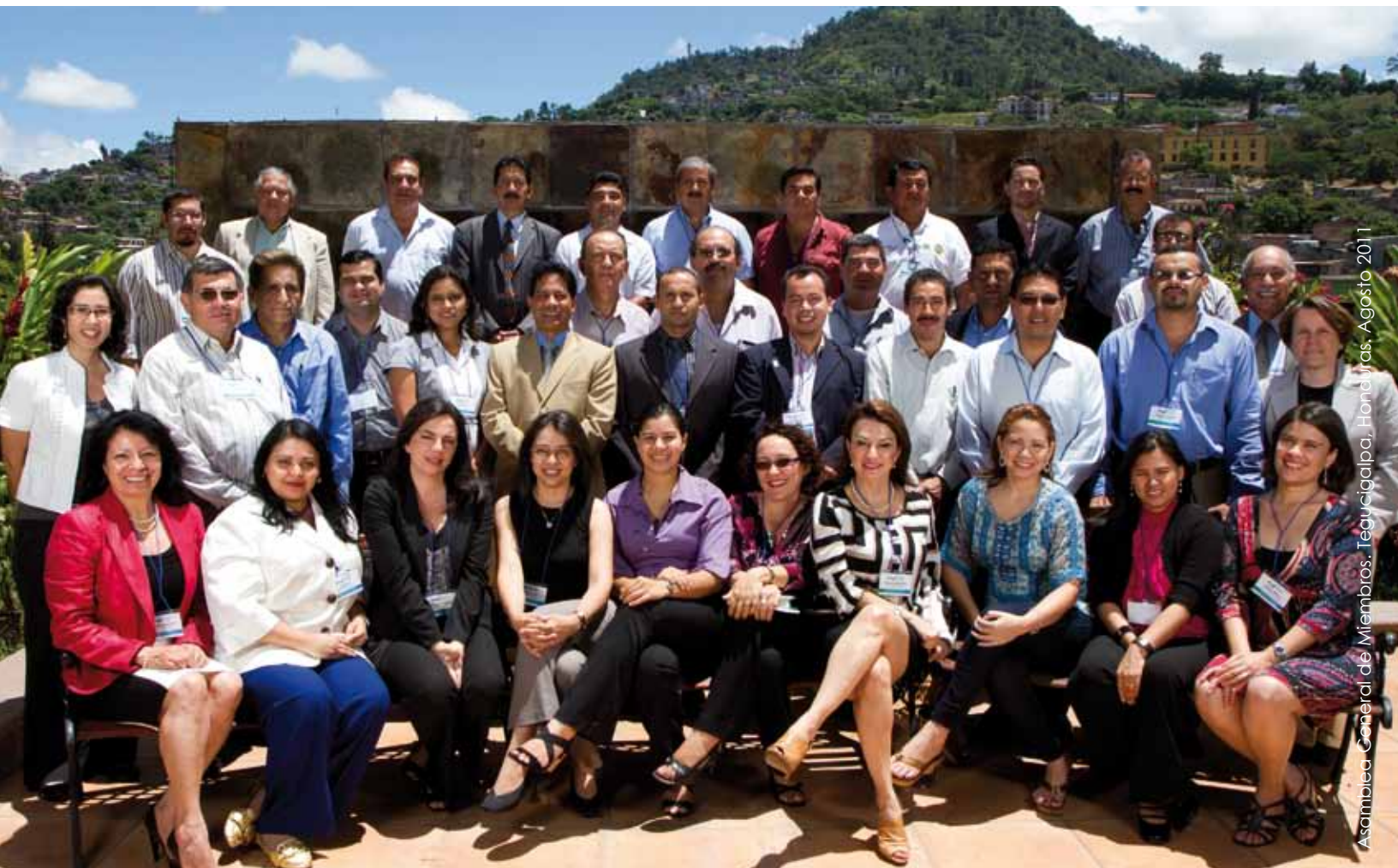
Asamblea General de Miembros, Tegucigalpa, Honduras, Agosto 2011

Todas las organizaciones involucradas en la gestión de los recursos hídricos son bienvenidas para ser parte de GWP. Ser parte de la red da la oportunidad de acceder a los recursos y experiencia de más de 160 miembros en Centroamérica y 2,500 miembros alrededor del mundo para aportar a la soluciones necesarias en la región para el manejo del recurso hídrico. GWP Centroamérica está conformado por miembros de Belice, Guatemala, El Salvador, Honduras, Nicaragua, Costa Rica y Panamá.