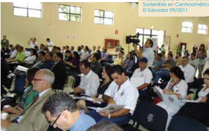
Foro Internacional de Cambio Climático: Desafíos y Oportunidades para una Caficultura Sostenible en Centroamérica. El Salvador 09/2011