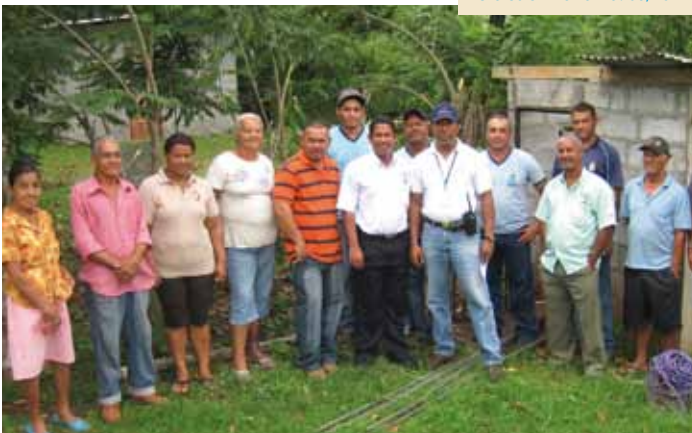
Limpieza de filtros pozos de los sistemas de acueductos rurales en Panamá. 06/2011