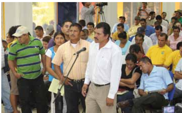
Foro sobre los CAPS y la Ley 722 en Nicaragua, 05/2011

Con este trabajo, GWP Honduras se ha convertido en uno de los principales promotores en la aplicación de la Ley General de Agua, apuntando así a las grandes metas de desarrollo sostenible del país.