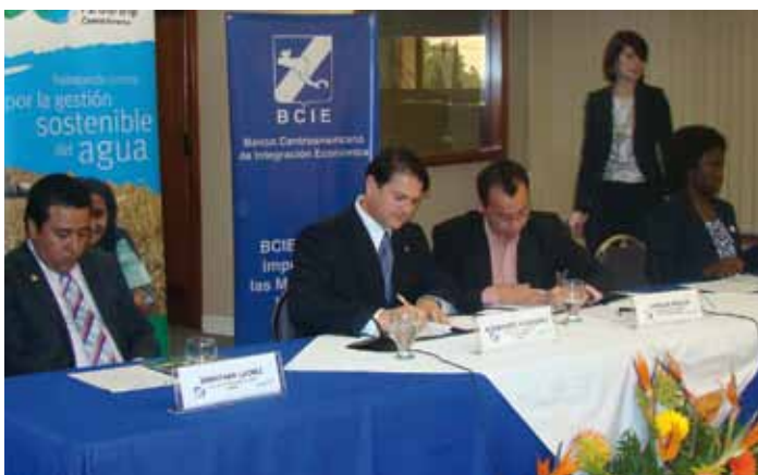
Firma de convenio con el BCIE, 03/2011