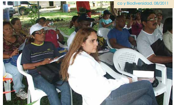
Encuentro de Periodistas de Panamá y Colón: Desarrollo Sustentable, Cambio Climático y Biodiversidad. 08/2011

GWP Costa Rica apoyó a un equipo de estudiantes de ingeniería de la Facultad de Agronomía de la Universidad de Montpellier, Francia, con el fin de desarrollar una pasantía en la Comisión para el Ordenamiento y Manejo de la Cuenca Alta del Río Reventazón (COMCURE) a finales de abril del año 2011. La Cuenca del Río Reventazón es parte de la red de cuencas del "Programa Hidrológico Internacional" de la Unesco y su