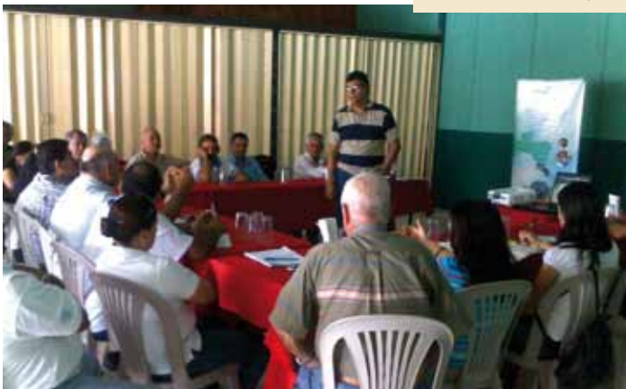
Talleres sobre la implementación del Plan Nacional de GIRH en Costa Rica. 06/2011