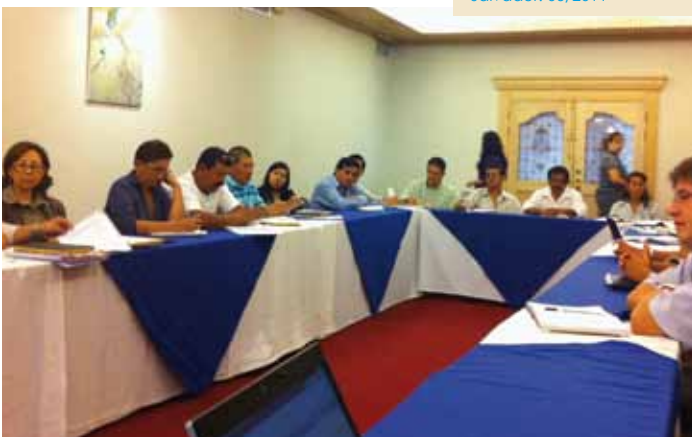
Reunión de consulta para la Reforma Hídrica de El Salvador. 06/2011