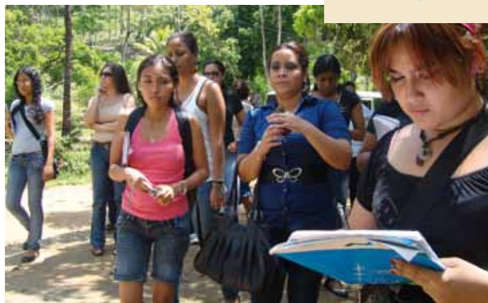
Taller con estudiantes de periodismo de la Universidad de Panamá. 05/2011

Este año, se inauguró el "Diplomado en Gestión de Riesgos para el Desarrollo Sostenible del Territorio", en el Valle de Jiboa, zona central del país. El objetivo que se busca es generar escenarios de seguridad humana integral, manejo de desastres y procesos de reconstrucción; para que haya equilibrio entre la comunidad y el medio ambiente en la zona. El diplomado se ha organizado en siete módulos con una duración de 6 meses (agosto 2011-febrero 2012) y cuenta con la participación 54 personas, representantes de los gobiernos municipales, protección civil, organizaciones no gubernamentales y actores organizados de 12 municipios del Valle del Jiboa.