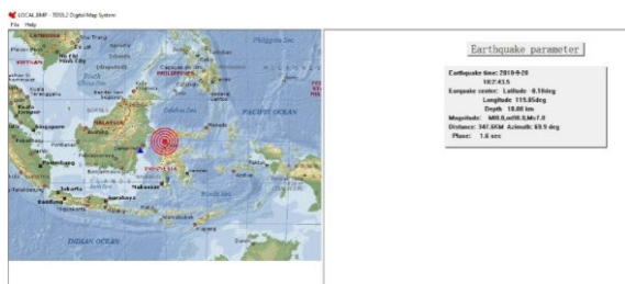
Gambar 2. Hasil Penentuan Lokasi Gempabumi Donggala tanggal 28 September 2018

Analisis selanjutnya dari waveform tersebut menunjukkan pusat gempa bumi berada di Donggala.