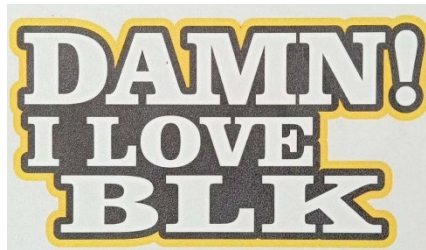
Damn, I love BLK.