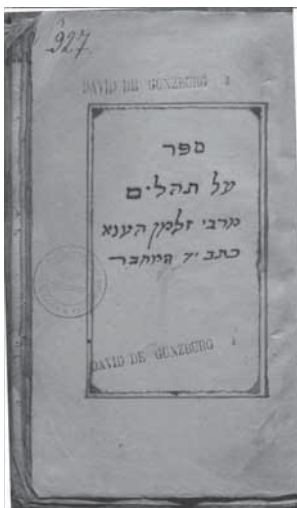
Рис. 2. Титульный лист рукописи «Комментария на Псалтирь» (Книгу псалмов?) (Ф. 71. Ед. хр. 927)

Большой интерес представляет рукописная часть собрания [6], насчитывающая в настоящее время 1913 ед. хр., среди них — 705 рукописей, имеющих владельческие записи, обзор которых приведен ниже. О прежних владельцах книг и рукописей мы узнаем, как правило, из владельческих записей и штампов, оставленных на форзаце, титульном или первом листе книги. Это могут быть краткие записи типа «принадлежит такому-то» либо дополнительная информация о том, когда и у кого данная книга куплена и т. п. В данном случае мы не ставили перед собой задачу проанализировать все виды владель-