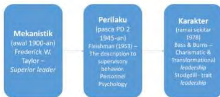
Gambar 1.1. – Perkembangan penelitian leadership : Bagaimana pengaruhnya terhadap konstruksi sosial?

Dengan adanya dekade penelitian mengenai leadership , tentulah membawa masyarakat untuk memiliki konstruk pemikiran yang serupa tentang leadership . Hal ini membuat masyarakat dalam kurun waktu terakhir (1990-2010) memiliki fokus gila-gilaan terhadap leadership . Peneliti pun membandingkan trend diantara tiga kalangan masyarakat melalui pencarian kata kunci leadership dan followership di masyarakat umum (situs: google.com), peneliti dan akademisi (situs: sciencedirect.com), dan civitas akademika ubaya (situs: digilib.ubaya.ac.id). Hasilnya pun ditemukan bahwa leadership jauh lebih signifikan di ketiga golongan masyarakat ini.