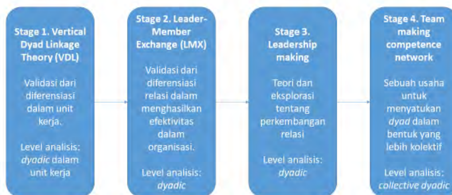
Gambar 3 Perkembangan teori LMX dari tahap ke tahap. (disadur dari Graen & Uhl-Bien, 1995)

untuk membentuk relasi yang dewasa (Graen & Uhl-Bien, 1995). Relasi yang dewasa inilah yang berjalan secara efektif dan tertuang dalam dialektika leader-follower yang maksimal. Peneliti berargumen bahwa analisis yang ada di dalam ini akan mampu digunakan untuk memperjelas adanya batasan baru dalam Leader-Member Exchange yang berada di stage 2. Penelitian ini memperoleh tiga hasil argumentasi dasar yaitu: