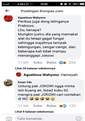
Gambar 3. Screenshoot Berita Hoax