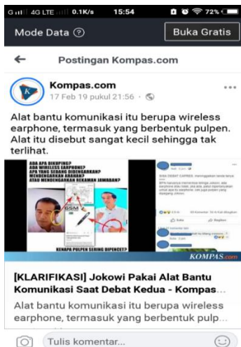
Gambar 2. Screenshoot Berita Hoax