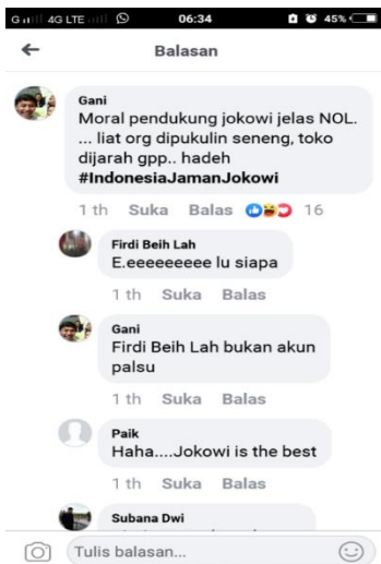
Gambar 6. Screenshoot Berita Hoax