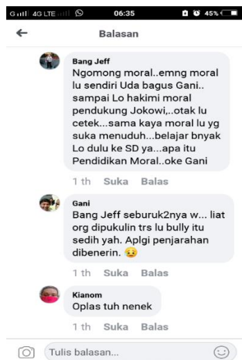
Gambar 7. Screenshoot Berita Hoax