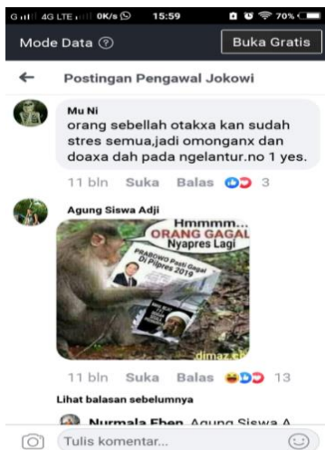
Gambar 5. Screenshoot Berita Hoax