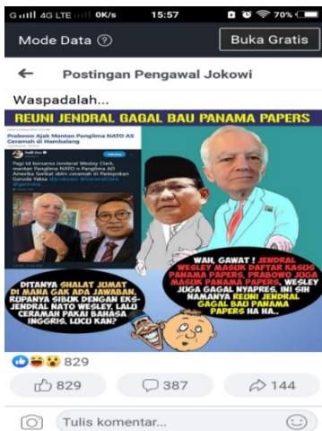
Gambar 4. Screenshoot Berita Hoax