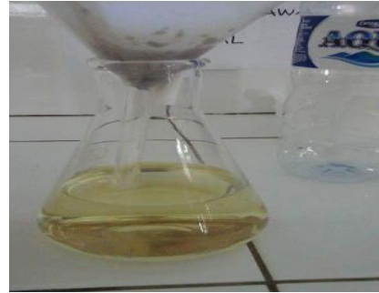
Gambar 2 Asap cair setelah destilasi