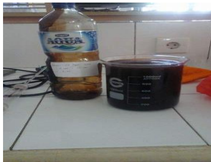
Gambar 1 Asap cair sebelum destilasi

Begitu pula untuk sampel kedua yaitu tongkol jagung, seperti pada sampel pertama, warna asap cair yang didapatkan sebelum destilasi adalah coklat yang agak kekuningan sedangkan setelah dilakukan proses destilasi, warna asap cair yang didapatkan adalah kuning pucat, hal ini menandakan bahwa destilasi juga sangat berpengaruh besar terhadap kualitas asap cair tongkol jagung.