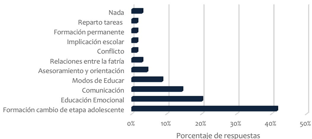
Figura 3. Descripción de los nuevos problemas a los que se han enfrentado o se están actualmente enfrentando y consideran que requieren más formación