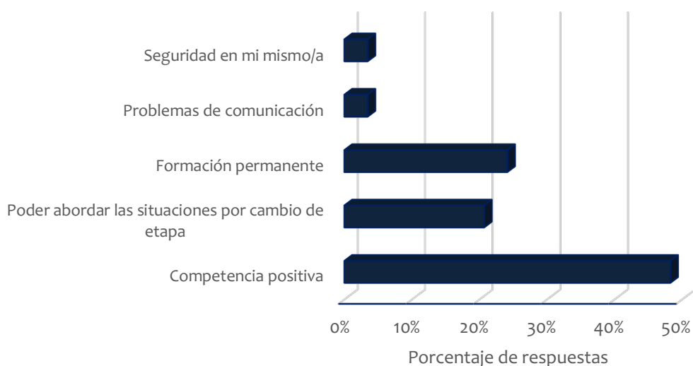
Figura 2. Descripción de la competencia parental percibida

Por último, respecto a cuáles son las principales demandas que plantean los padres y madres en la actualidad (Figura 3), el porcentaje mayoritario se encuentra en recibir formación en el cambio de etapa adolescente (41,43%):