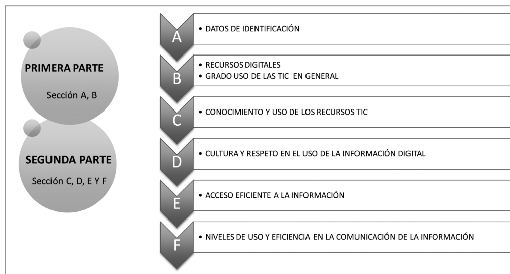
IMAGEN 2 PARTES DEL CUESTIONARIO INCOTIC-ESO

como en el domicilio, y también teléfono móvil) y al lugar donde cotidianamente se produce ese acceso. Por otro lado, nos interesa conocer, especialmente, cuál es el grado real de uso de las TIC en general, no sólo en el contexto académico universitario (usos generales y específicos, tiempo promedio y frecuencia, aportes fundamentales de las TIC).