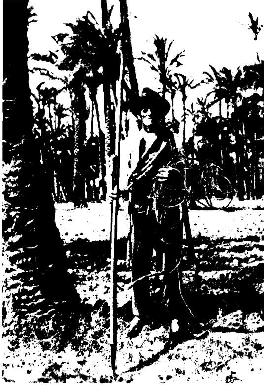
4. Los paisajes del agua dan lugar a formas de vida de gran interés etnológico, como los palmereros de Elche.

cuando las cosechas se encuentran en plena maduración. El pleno desarrollo de la agricultura exigió desde tiempos remotos la práctica del regadío: la captación, almacenaje, transporte y distribución de las aguas superficiales o subterráneas en beneficio de los sedientos campos de cultivo. Para regar, sin embargo, no basta con llevar el agua al campo. El trazado de las acequias y el parcelario por ellas servido deben ser cuidadosamente nivelados, para que el agua fluya a velocidad controlada, sin estancarse ni erosionar el terreno.