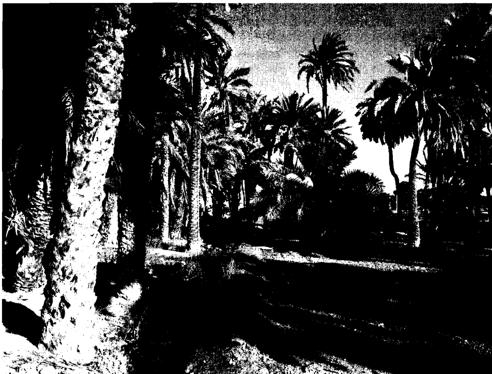
3. La Acequia Mayor continúa regando los huertos del Palmeral Histórico de Elche, como en época andalusi

contexto de la Lista del Patrimonio Mundial. La propia definición de patrimonio inmaterial es objeto de crítica, puesto que hace extensiva la naturaleza de patrimonio intangible a los bienes tangibles que constituyen su vehículo y soporte.