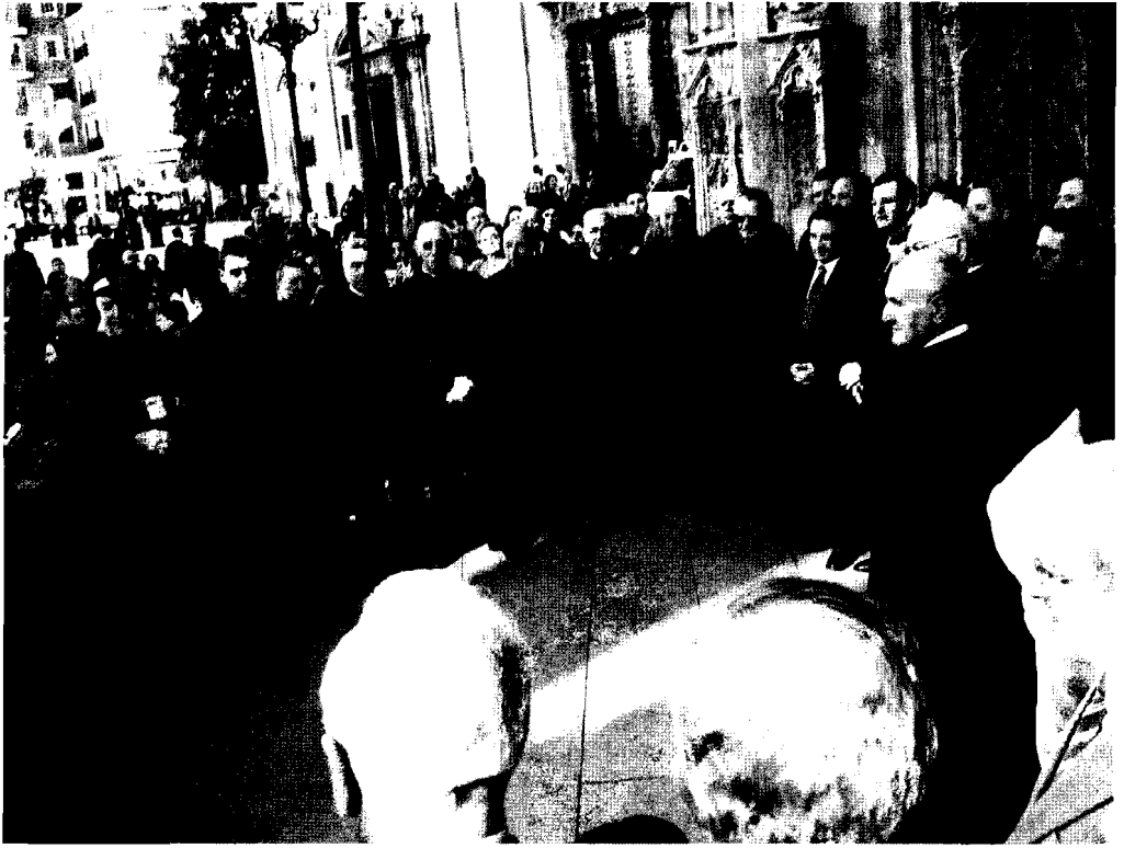
6. Reunión del Tribunal de las Aguas y el Consejo de Hombres Buenos en la Puerta de los Apóstoles de la Catedral de Valencia el jueves 20 de enero de 2005.

su diseño físico e institucional a lo largo del tiempo reflejan la huella de los cambios históricos, con su sucesión de civilizaciones y formas de vida. Nos informan de la evolución de los núcleos de población a los que se encuentran vinculados, y, a la par, nos cuentan una historia de mucha mayor trascendencia histórica y geográfica: la de Al-Andalus como crisol de la revolución agrícola árabe, basada en una cultura del agua extraordinariamente refinada.