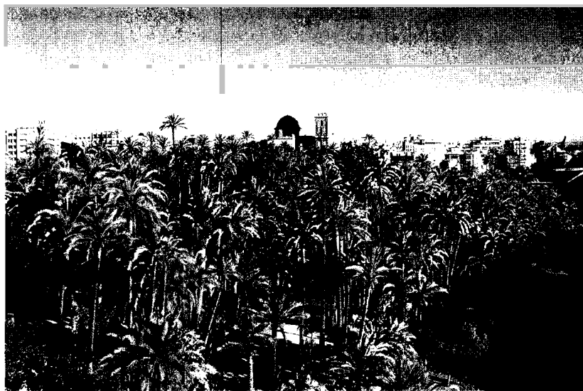
1. La Basílica de Santa María, escenario del Misteri o Festn d'Elx , preside el Palmeral, como otrora lo hiciese la mezquita mayor de Elche.

La UNESCO, sin embargo, era plenamente consciente de la insuficiencia de la definición de patrimonio cultural de la Convención del Patrimonio Mundial, así como del lastre que ello suponía para el pleno desarrollo de sus políticas patrimoniales 5 . En las décadas anteriores,