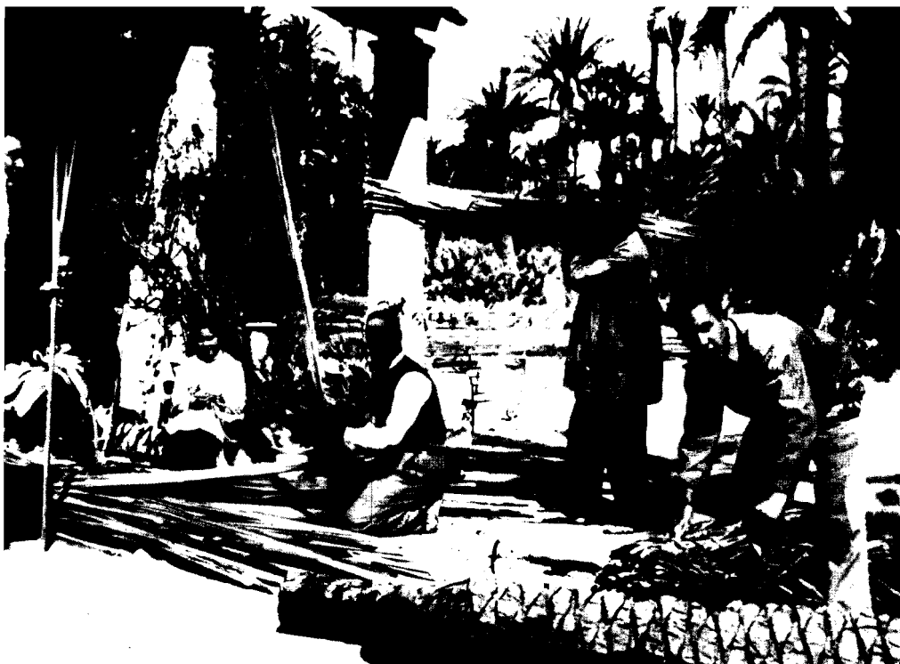
5. La artesanía de la palma blanca ha sido el sustento de la economía de muchas familias de Elche.

de los yacimientos arqueológicos. Por el contrario, en nuestras huertas, como paisaje cultural vivo, la relación entre la componente material e inmaterial es de estrecha y mutua dependencia: hecho que debe ser tenido muy en cuenta a la hora de diseñar políticas de salvaguarda y promoción efectivas. La dimensión inmaterial de la cultura del agua tradicional depende, para su mantenimiento, de la preservación del sustrato material que constituye su razón de ser, por lo que los planes de acción para su protección deben incorporar medidas específicas de tutela del suelo y del agua de las huertas. Por otra parte, el mantenimiento e incluso la restauración de los paisajes del agua en condiciones de autenticidad (principio clave de la doctrina UNESCO en materia de patrimonio cultural), exigen el mantenimiento, la potenciación y la recuperación de la práctica agrícola ancestral, de acuerdo con el sustrato preindustrial.