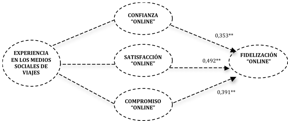
Figura 4 COEFICIENTES ESTANDARIZADOS DEL MODELO ESTRUCTURAL (RELACIÓN INDIRECTA ENTRE LA EXPERIENCIA EN LOS MEDIOS SOCIALES DE VIAJES-CALIDAD DE LA RELACIÓN-FIDELIZACIÓN)