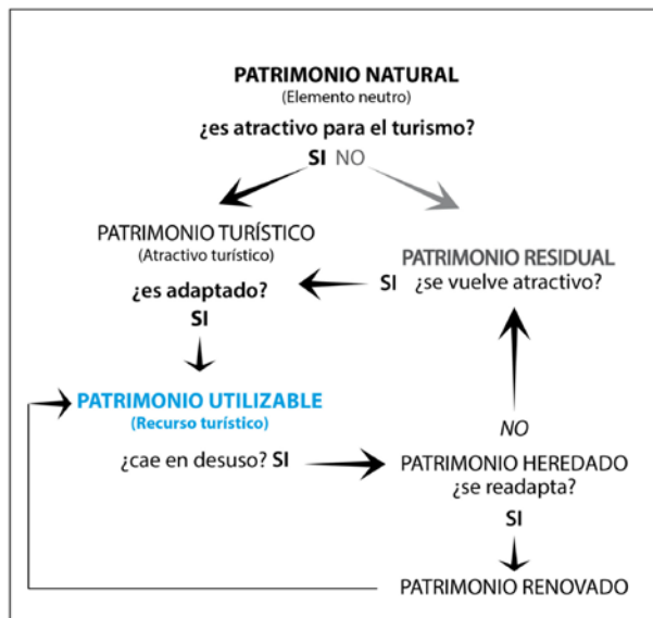
Gráfico 3 TEORÍA DE LA RENOVACIÓN DEL PATRIMONIO TURÍSTICO