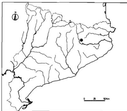
FIG. 1. Localización geográfica del valle de Vidrà (Girona).

El conjunto estudiado alcanza los 15 m de altura por la orilla izquierda del arroyo, con una pendiente de unos 45°. Su orientación noroeste le confiere unas características especialmente húmedas, sombreadas y fresca. No se trata de paredes lisas cubiertas exclusivamente de briófitos, sino que presentan zonas en donde se acumula la