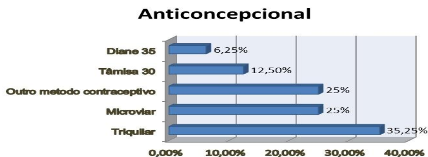
Gráfica I: Distribución de la frecuencia de uso de anticonceptivos

Cuando se les preguntó sobre el uso de anticonceptivos, se obtuvieron las siguientes respuestas, como puede verse en la siguiente gráfica. La gráfica I presenta el uso de anticonceptivos orales utilizados por las participantes del estudio.