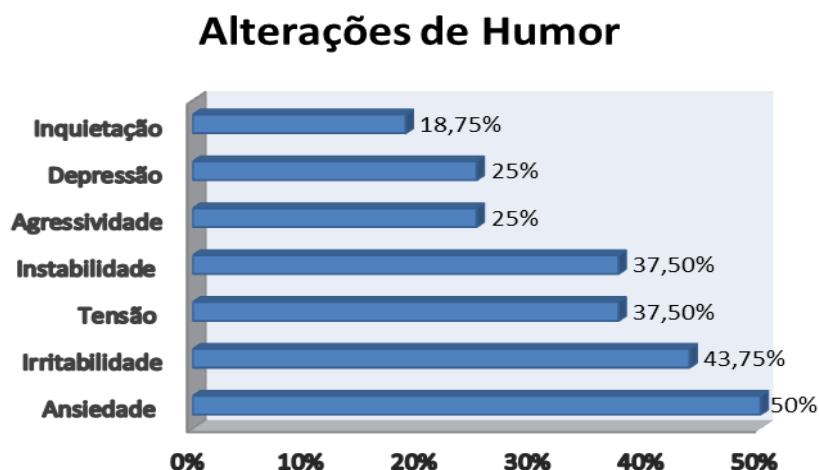
Grafica III: Distribución de la frecuencia de alteraciones del humor

En la gráfica de abajo son presentadas las alteraciones del humor de las mujeres.