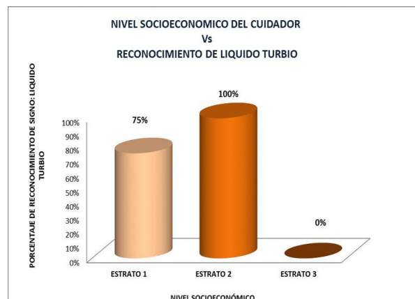
Figura 1. Hallazgos de la primera visita. Nivel socioeconómico en relación con reconocimiento de líquido turbio

En la segunda visita domiciliaria para la evaluación de la adherencia a las indicaciones de la diálisis peritoneal en casa, enseñadas al Cuidador por parte de Enfermería, se cruzaron las variables de nivel socioeconómico, comparado con el porcentaje de reconocimiento de signos de infección y se apreció que el estrato 1, 2 y 3 tuvo un porcentaje del 100%