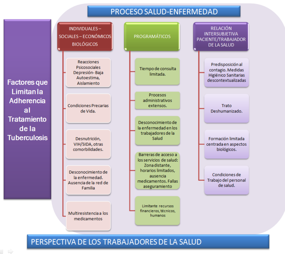
Gráfico N.º2. Factores que limitan la adherencia al tratamiento de la tuberculosis en la localidad, Bogotá, 2010

Dentro de los factores que se identifican como limitantes en la adherencia al tratamiento de la tuberculosis en los pacientes desde la perspectiva de los trabajadores de la salud se observan, desde lo individual, aspectos socioeconómicos, fisiopatológicos, programáticos y la relación intersubjetiva entre el trabajador de la salud y el paciente, tal como se representa a continuación: