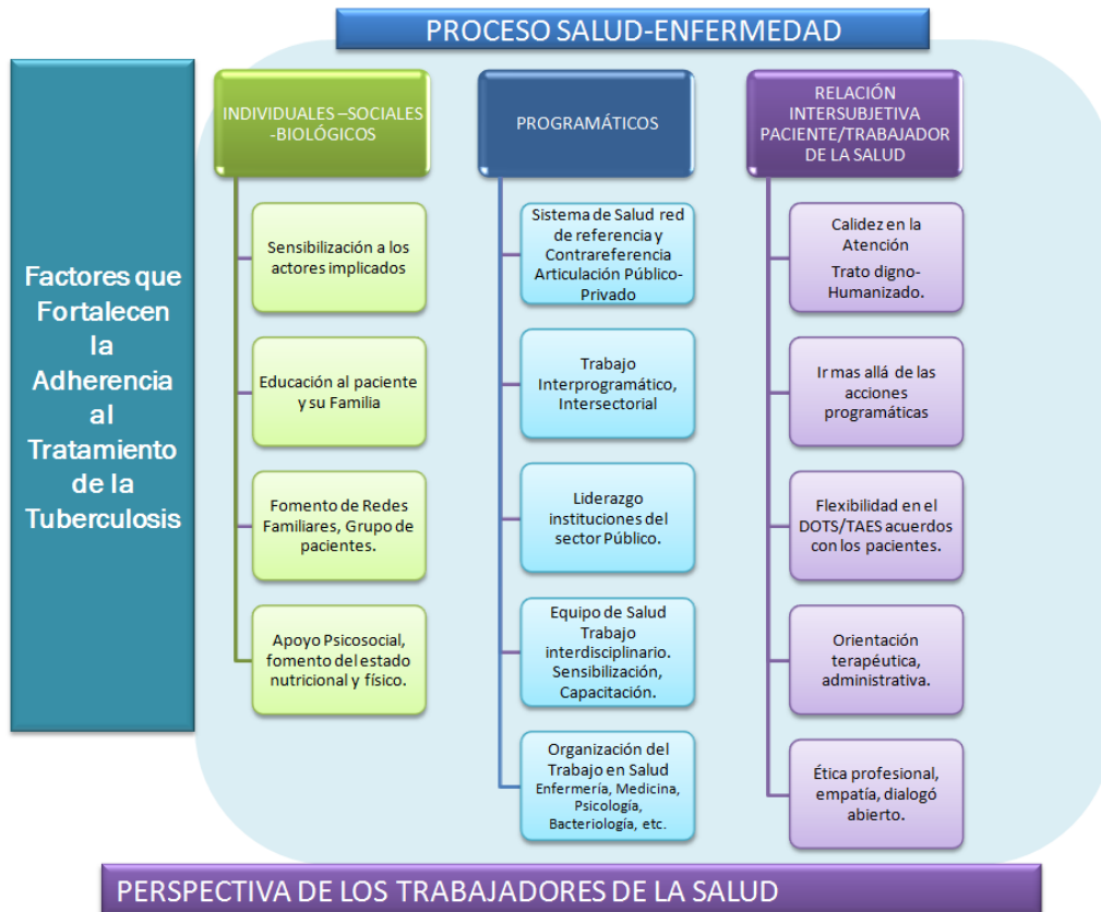
Gráfico N°3. Factores que fortalecen la adherencia al tratamiento de la tuberculosis en los pacientes de la localidad estudiada, Bogotá, 2010

Los aspectos cognitivos, comportamentales, sociales y programáticos y la relación paciente-trabajador de la salud son identificados por los trabajadores de la salud como factores que fortalecen la adherencia del tratamiento de la tuberculosis (ver gráfico N.º 3).