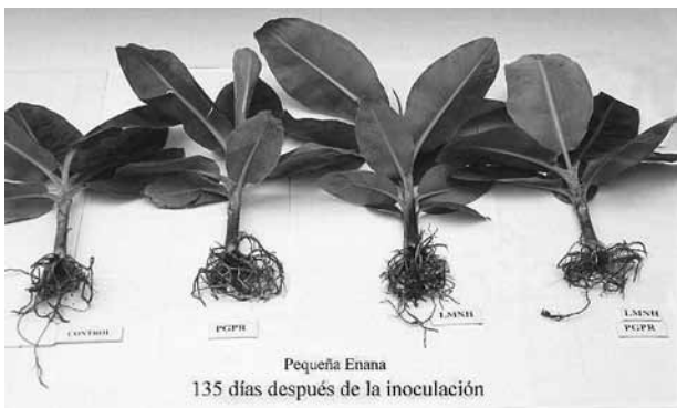
Figura 5. Efecto del hongo MA Glomus manihotis (LMNH) y un consorcio de bacterias promotoras del crecimiento del género Bacillus (PGPR) sobre el desarrollo de platanera micropropagada, cv. Pequeña Enana, 135 días después de la inoculación.

A partir de nuestros resultados y de los de otros muchos investigadores que siguen líneas similares a la nuestra, tenemos la certeza del papel protagonistas de estos microorganismos en la fertilidad de los suelos y que la aplicación de estos microorganismos rizosféricos, durante las primeras fases de desarrollo de los cultivos,