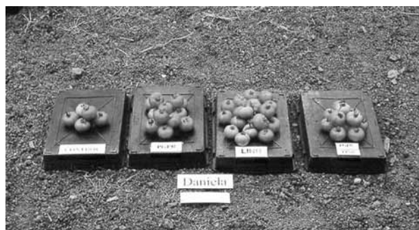
Figura 3. Efecto del hongo MA Glomus intraradices (LINR) y de las bacterias promotoras del crecimiento (PGPR) sobre la cosecha de tomates del cv. Daniela, bajo manejo ecológico.

La platanera ( Musa acuminata Colla AAA) es actualmente el cultivo de mayor interés económico y ecológico para nuestra región. Hacia él se dirigen muchos esfuerzos a nivel de investigación y su interacción con los microorganismos benéficos de la rizosfera ha sido