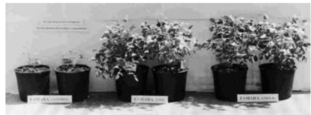
Figura 1. Efecto de Glomus intraradices (LINR) y G. mosseae (LMSS-K) sobre el desarrollo de plantas de tederera ecotipo Famara en condiciones controladas de cultivo, 6 meses después de la inoculación.

La papaya ( Carica papaya L.) es una especie tropical adaptada a nuestras condiciones climáticas y edáficas cuyo cultivo se ha intensificado en nuestras islas a partir de las década de los ochenta. La capacidad micorrícica de este cultivo ha sido registrada por algunos autores (Casagrande et al. 1986). En nuestras condiciones hemos comprobado la idoneidad de aplicar los hongos MA, durante las primeras fases de desarrollo, consiguiendo incrementos en el crecimiento y la nutrición (Tabla 3 y Figura 2), que aceleran hasta 45 días el trasplante a campo (Jaizme-Vega y Azcón 1995).