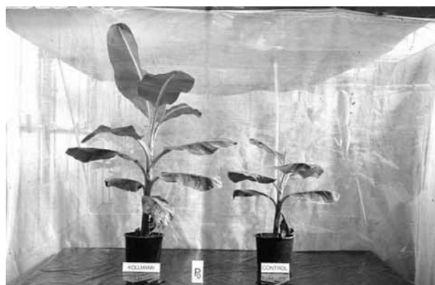
Figura 4. Efecto del hongo MA Glomus mosseae (maceta de la izquierda) sobre el desarrollo de platanera micropropagada, cv. Gran Enana, en condiciones de vivero comercial.

objeto prioritario de estudio por nuestro grupo. Actualmente el sistema más extendido de nuestra especie es el cultivo in vitro. Esta técnica se combina muy bien con la micorrización temprana, optimizando el enraizamiento y el desarrollo de la microplántula de platanera (Figura 4) (Jaizme-Vega y Azcón 1995, Jaizme-Vega et al. 2002, Rodríguez-Romero 2003). Una vez determinado el efecto positivo que representa la micorrización del ma-