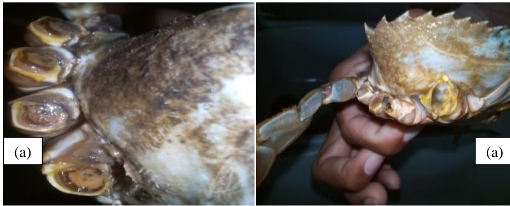
Gambar 2. Tingkat Kesembuhan Kepiting Bakau : (a) Kesembuhan Kaki Jalan, (b) Kesembuhan Capit

Dari gambar Grafik 1 menunjukkan bahwa pemberian ekstrak bawang putih mampu menyembuhkan luka akibat mutilasi pada kaki jalan bagian kiri dan kanan juga capit kiri dan kanan pada kepiting bakau dengan menggunakan konsentrasi ekstrak bawang putih 10%. Akan tetapi dilihat dari grafik tersebut bahwa persentase kesembuhan dengan menggunakan ekstrak bawang putih lebih cepat bereaksi pada kedua capitnya dibandingkan dengan kedua kaki jalan. Untuk mengetahui lebih jelas persentase kesembuhan luka akibat mutilasi pada kepiting bakau dapat dilihat pada Gambar berikut.