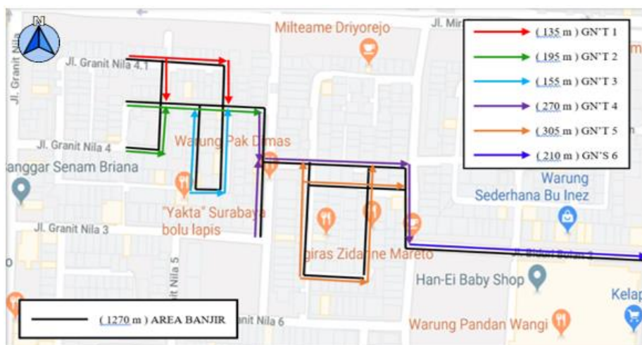
Gambar 1. Denah Luasan Area

Analisa waktu konsentrasi menggunakan rumus T_c = T_o (Waktu yang dibutuhkan untuk mengalir di permukaan untuk mencapai inlet) + T_f (Waktu yang dibutuhkan untuk mengalir di sepanjang saluran untuk mencapai outlet), dengan denah pembagian luasan tiap segment saluran dapat dilihat pada gambar 1, hasil T_o pada tabel 3, hasil t_f pada tabel 4, dan hasil T_c pada tabel 5.