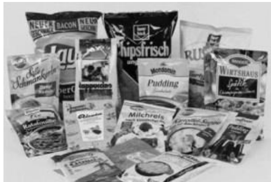
Gambar 1. Model kemasan

ancaman seperti kontaminasi organisme ataupun gesekan, benturan, dan getaran. Mempunyai ukuran yang standar, mudah dibuang dan mudah untuk di bentuk atau dicetak.