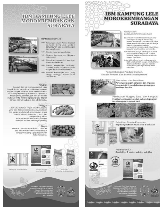
Gambar 6. Banner Kelompok Tani Cipta Bersama

antara tim peneliti dengan ketua kelompok tani dan perwakilan anggotanya, didapatkan 2 alternatif banner sebagai berikut :