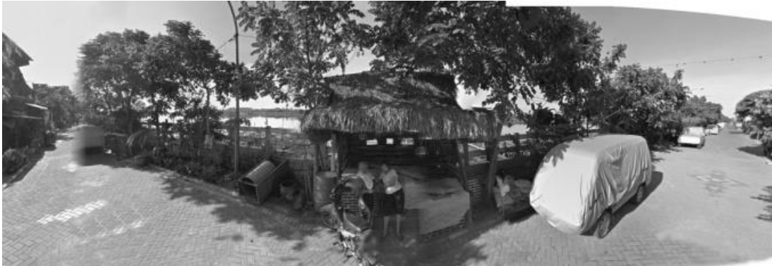
Gambar 2. Lokasi Kampung Lele di Morokrembangan Surabaya

Kegiatan yang dilakukan dalam IbM ini antara lain :