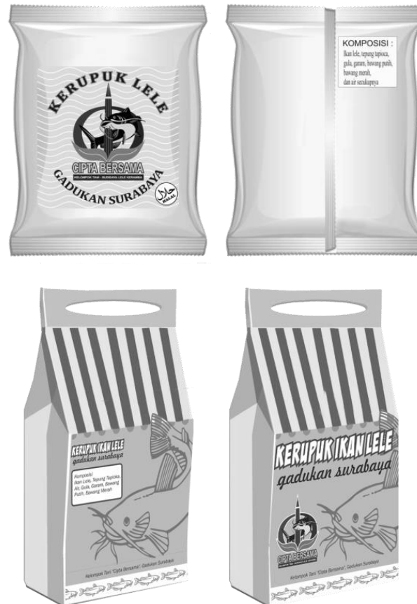
Gambar 3. Kemasan plastik dan kardus produk olahan lele