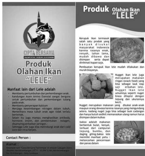
Gambar 5. Flyer Kelompok Tani Cipta Bersama untuk produk olahan lele

Flyer / brosur digunakan untuk menunjang kegiatan pameran yang diikuti oleh kelompok tani di tingkat kota. Brosur/flyer ini membantu kelompok tani dalam mempromosikan produk-produk hasil olahan ikan lele kepada para pengunjung pameran. Berikut flyer / brosur yang telah dicetak :