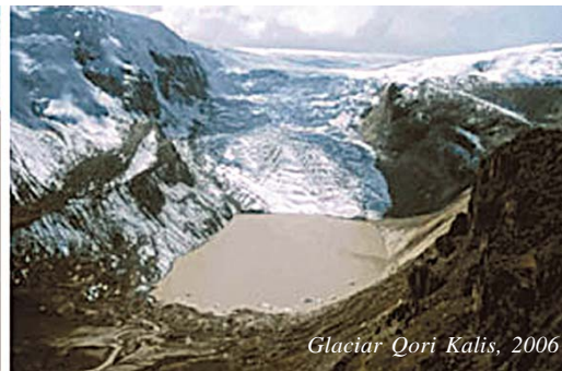
Glaciar Qori Kalis, 2006