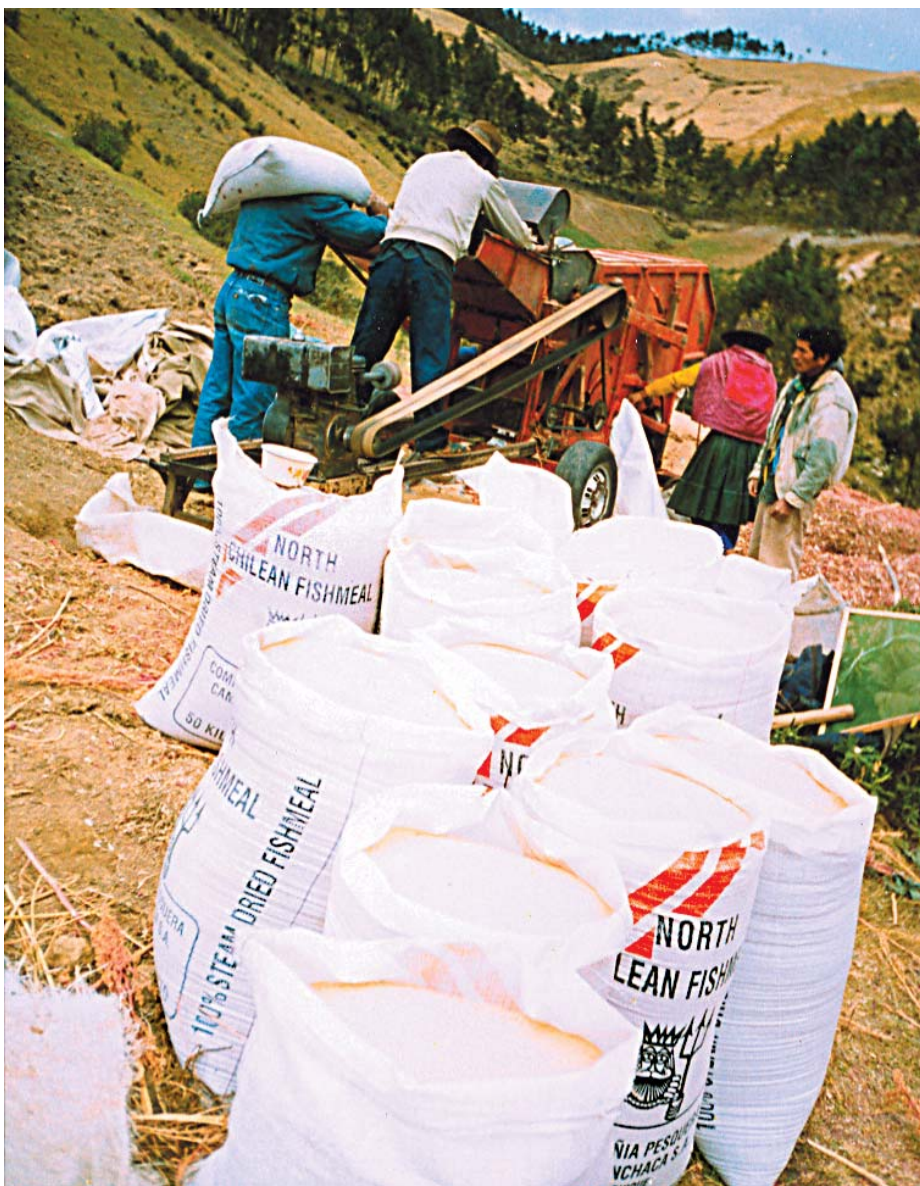
DIFICULTADES. Los productores de Auquibamba deben superar problemas como el descenso de la productividad de sus tierras.