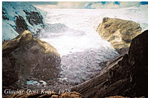
Glaciar Qori Kalis, 1978

Pero el retroceso de los glaciares no es el único impacto dramático del cambio climático en los Andes: una de las principales consecuencias es el desplazamiento hacia arriba de los rangos ecológicos altitudinales, es decir, que las condiciones ecológicas (temperatura, lluvias, etc.) que antes imperaban a determinada altitud, ahora se han desplazado a una altitud mayor. Este fenómeno compromete la subsistencia de algunas especies e incrementa la vulnerabilidad de los ecosistemas. Otras consecuencias son la variación de la extensión y ubicación de los pastizales, y la modificación de los flujos de agua de deshielo. Respecto a este último punto, el impacto del cambio climático está poniendo en riesgo la pro-