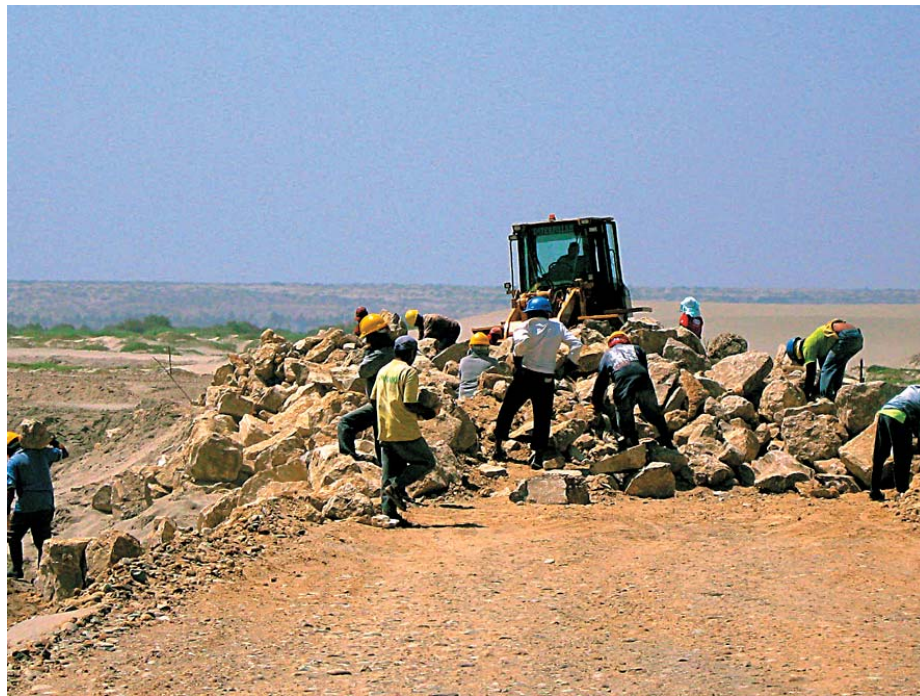
ACUERDO. Convenio entre comunidad de San Lucas de Colán y petrolera Olympic vincula incremento de la producción petrolera con pago a comunidad.

minución de la productividad de la tierra en los últimos años. «Al principio le vendíamos a Alisur ciento cincuenta toneladas por campaña. Pero en la última no hemos sacado ni cincuenta toneladas». El problema, según Hurtado, está