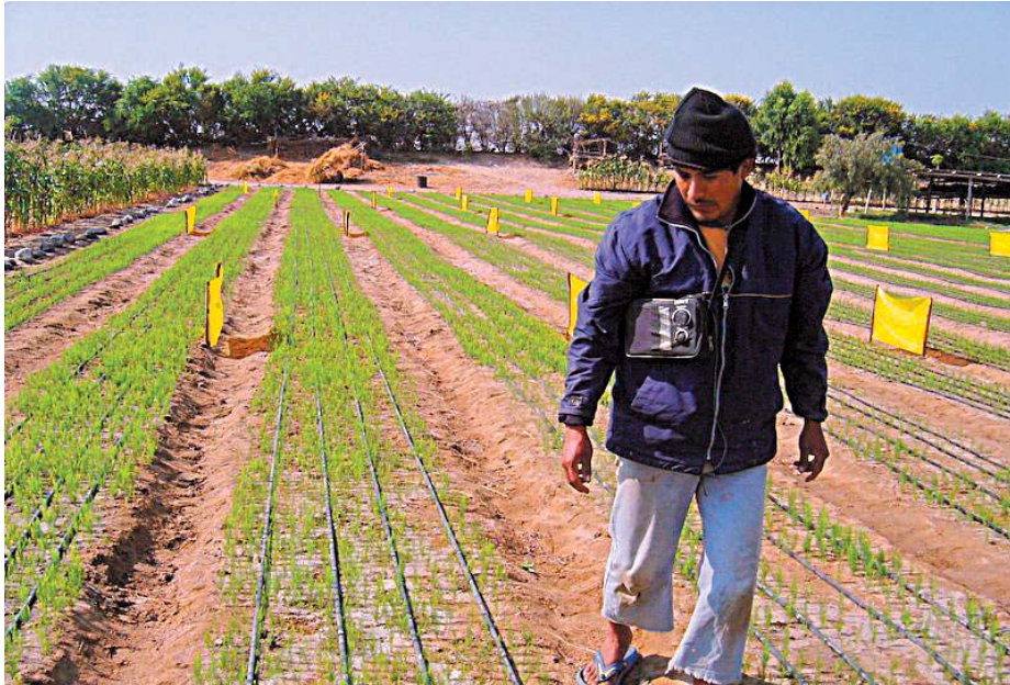
MEJORES PRECIOS. La Asociación de Productores del Valle de Auquibamba, en Apurímac, vende sus frijoles a la empresa Alisur, a mejores precios que a intermediarios.

Pero la parte interesante de los acuerdos logrados entre ambas partes es el vínculo legal que se ha establecido entre el incremento de la producción petrolífera y los pagos a la comunidad: cada vez que la empresa incrementa su producción en 200 barriles