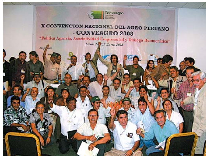
Una vez más, el agro peruano se reúne en una jornada nacional. Se viene la XI Conveagro.

Para la XI Conveagro se ha convocado delegaciones de gremios, organizaciones, Conveagro Regionales, Gobierno, Congreso de la República, cooperantes, Red Nacional de Periodistas Agrarios, Conveagro Juvenil e interesados.