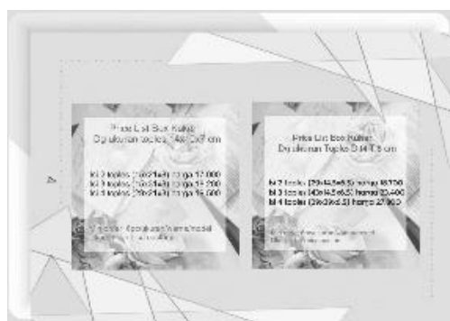
Gambar 5: Desain Katalog Produk

c. Solusi dalam mengatasi masalah Pemasaran: