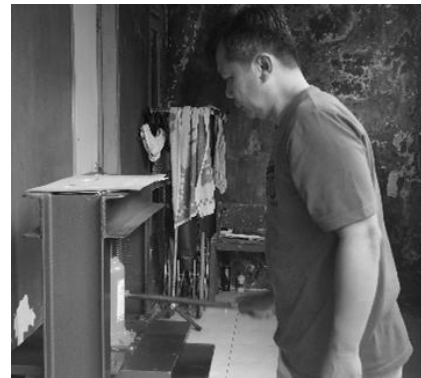
Gambar 4: Peralatan Plong Kertas/Karton Tenaga Dongkrak

Dalam mengatasi masalah kecepatan produksi dilakukan dengan pembuatan 1 buah alat plong kertas dan karton bertenaga dongkrak serta pembinaan operasional peralatan plong kertas selama 1 minggu. Dampaknya terlihat dari jumlah produk 100 buah gift box yang semula memerlukan waktu 7 hari dengan alat plong kertas/karton bertenaga dongkrak dapat diselesaikan dalam waktu 3 hari sehingga meningkatkan produktivitas lebih dari 2 (dua) kali dibandingkan produksi secara manual.