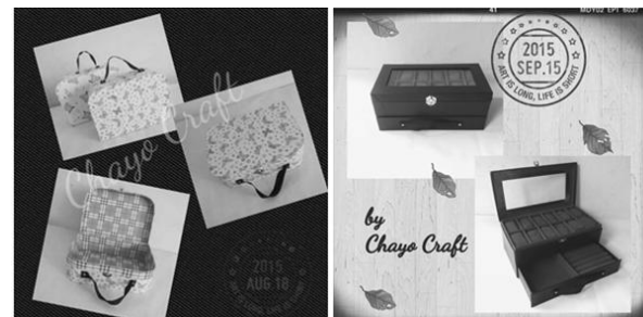
Gambar 1. Produk Gift Box

Bahan yang digunakan untuk membuat gift box cukup sederhana, diantaranya karton Jepang tebal, kertas kado, kertas hvs/samson, isolasi kertas, lem putih dan pita. Peralatan yang digunakan dalam memproduksi gift box juga sederhana, antara