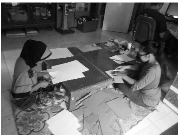
Gambar 3: Pemotongan Secara Manual