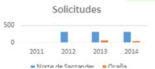
Gráfico 1. Consolidado solicitudes