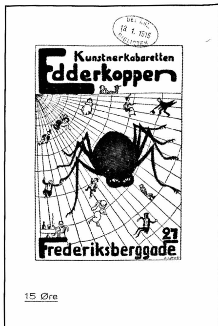
Robert Storm Petersens karakteristiske streg på Kunstnerkabaretten Edderkoppens program fra 1916.