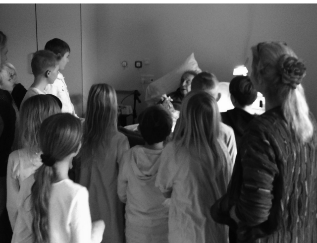
Friskolebørn besøger skolelederens døende far på hans værelse på hospice, d. 14/12 2018.